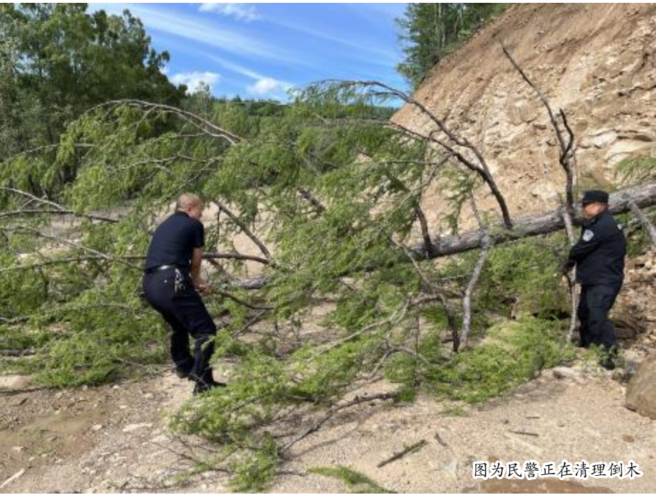
图为民警正在清理倒木

雨季到来，民警提示出行的车辆和群众，在途经容易发生滑坡、落石的路段时，一定要注意观察周边环境，确认安全后再通过，遇到险情时，第一时间报警求助。