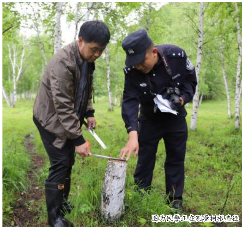
图为民警正在测量树根直径