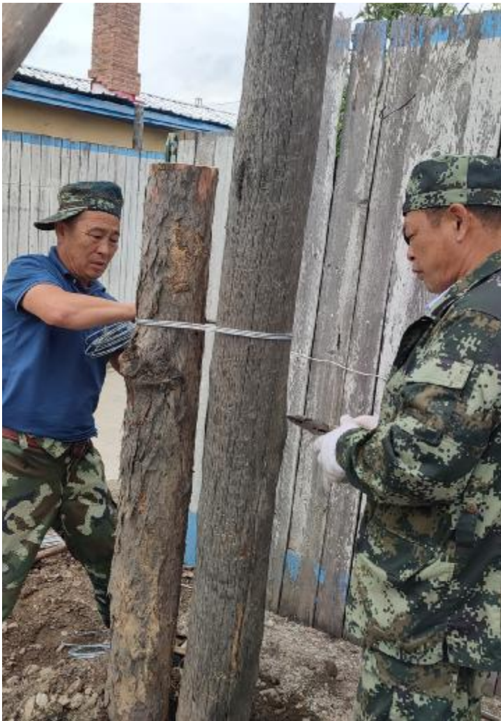
近日,阿龙山森工公司信息中心组织技术人员巡视检修主干线路,对倾斜线路进行更换、加固和扶正,撤并清理废旧线路。

工作条例》学习贯彻落实、疫情防控措施执行、公务用车管理、民警着装、值班记录、值班民警佩带枪支交接等情况进行细致检查。对检查中发现的问题,检查组责令立即进行改正,并督促各部门改进纪律作风,端正工作态度,严格执行各项纪律规定,不折不扣落实疫情防控各项措施,为党的二十大胜利召开创造良好的安全环境。