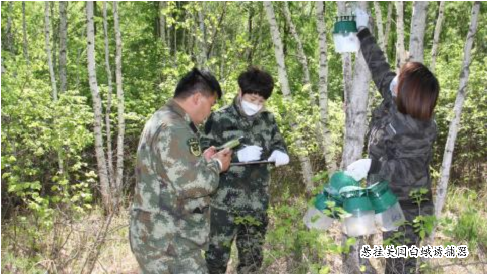
悬挂美国白蛾诱捕器