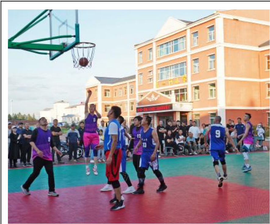
近日,克一河森工公司工会举办 2022 年度职工篮球赛,引导职工积极参加体育锻炼,丰富职工精神文化生活。