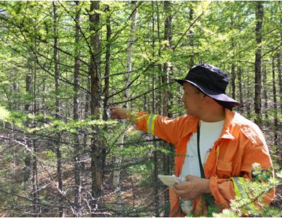
近日,金河森工公司森防站开展落叶松毛虫防治工作,技术人员将蜂卡固定在树干背阴处,达到生物防治的效果,降低落叶松毛虫的种群密度,保护森林资源。