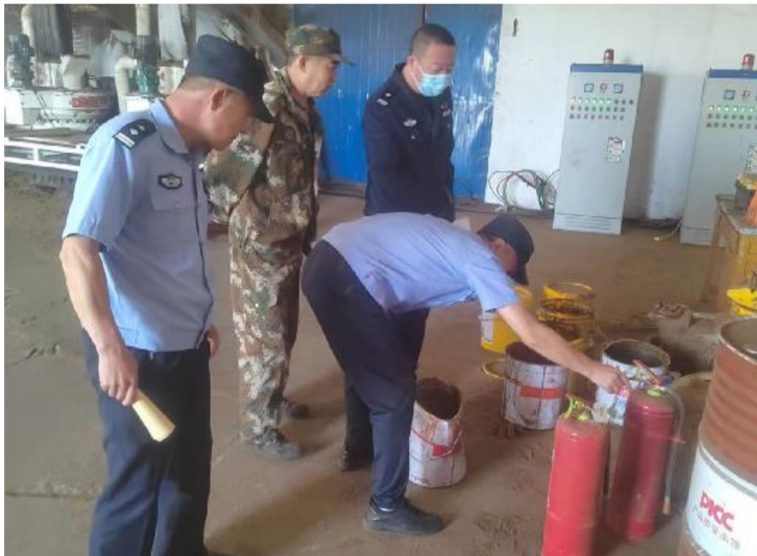
8月9日，内蒙古大兴安岭森林公安局绰尔分局绰源派出所对绰源森工公司生产单位进行消防安全隐患排查，确保辖区生产单位职工群众人身财产安全。 图为检查组正在检查绰源森工公司生物质能源颗粒厂消防安全设施。

党员民警带积极分子及非党员民警”的辐射带动效应。真正做到把党建、业务融合，并抓在平常，融入日常。 该党支部还开展经常性谈心谈话活动，党支部书记每月与全体民警开展谈心、交心、暖心、同心“四心谈话”，及时发现民警们的不良情绪、家庭矛盾、家庭困难及8小时以外的生活情况，并及时伸出援助之手，解除他们的后顾之忧，使全体民警能够更好地投入工作。充分发挥了古营河派出所党支部强党建、维稳定、保平安的政治核心作用和战斗堡垒作用。