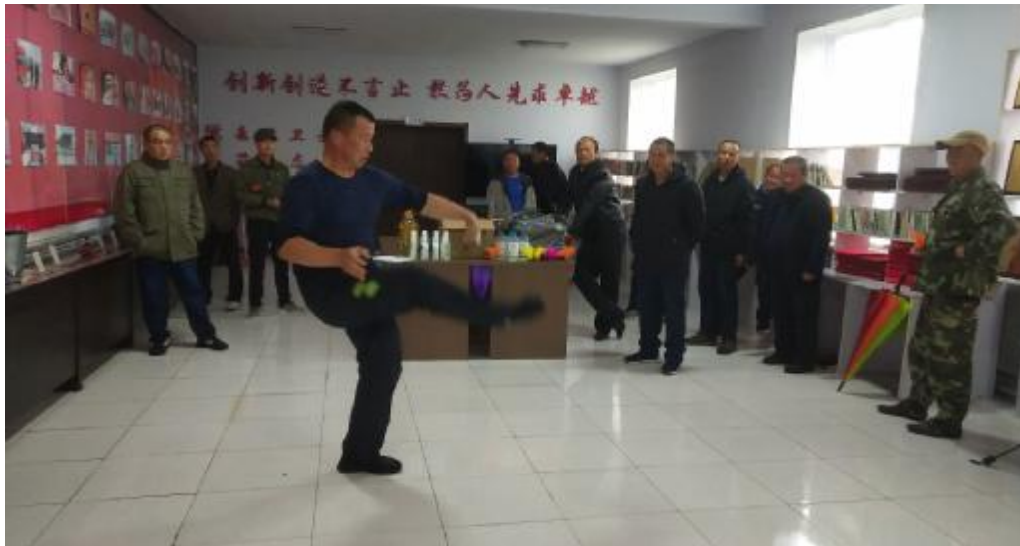
9月6日,金河森工公司应急事务处工会举办踢毽子比赛,丰富职工文化生活,营造和谐、快乐的工作环境。 ■ 葛殿芝 摄

本报讯(通讯员 冯桂荣)连日来,甘河森工公司工会组成家庭经济回访小组,调研回访近两年公司无息贷款扶持的职工家庭经济户实际情况。 调研组一行通过实地查看种植地块、面对面交流等方式,详细了解职工林下产品销售、特色餐饮、中草药种植、特色养殖等家庭经济项目的规模、前期投入、预期收益和当前新冠疫情防控形势下存在实际困难等情况,摸清职工心中所思、所想、所盼,为开展好家庭经济工作提供详实依据。