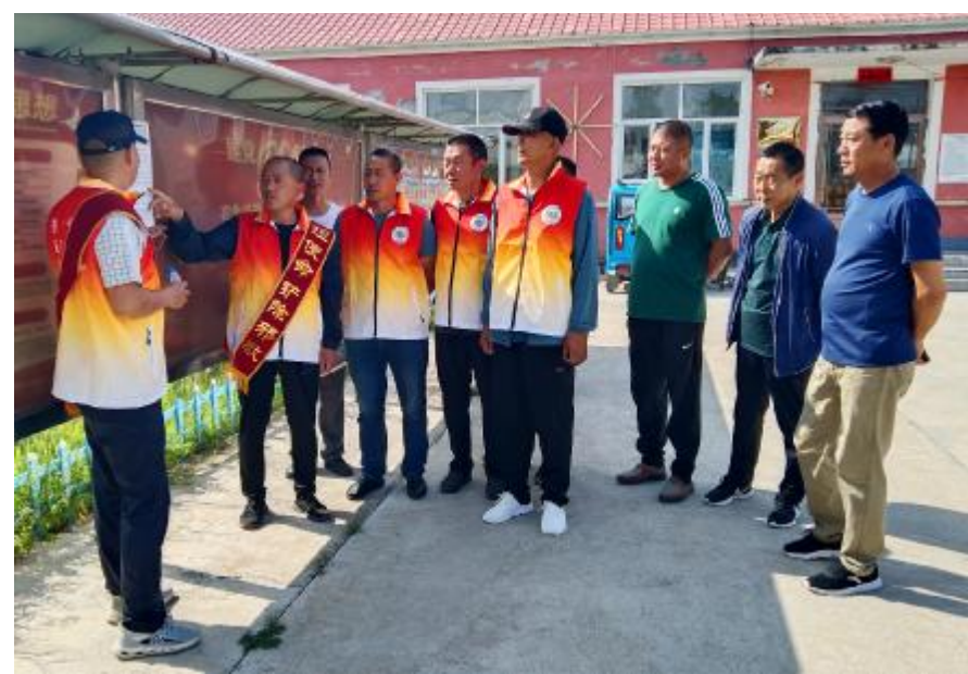
9月5日,吉文森工公司吉峰林场开展反邪教宣传活动,围绕“守初心服务群众 担使命铲除邪教”的主题,采取悬挂条幅、观看电教片、LED电子屏播放反邪教标语等形式,增强干部职工“崇尚科学 反对邪教”的意识。 图为综治干事讲解反邪教宣传挂图。