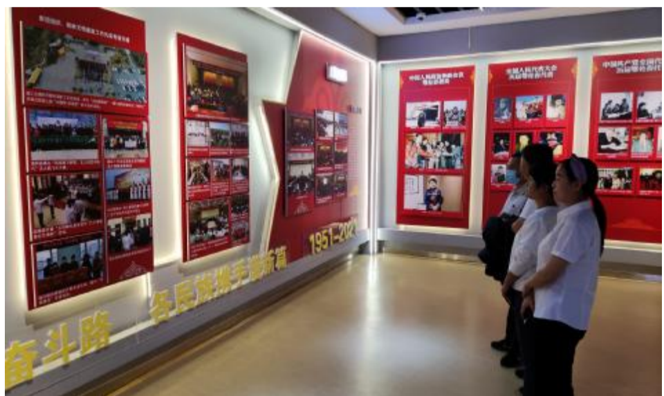
为增强铸牢中华民族共同体意识的思想自觉和行动自觉,9月15日,阿里河森工公司公路养护管理中心党支部开展“草原儿女心向党 同心共筑中国梦”主题党日,组织党员参观鄂伦春自治旗非遗传馆和鄂伦春自治旗成立70周年成就展,激发党员干部的爱党、爱国、爱家乡热情。 ■孙大伟 摄