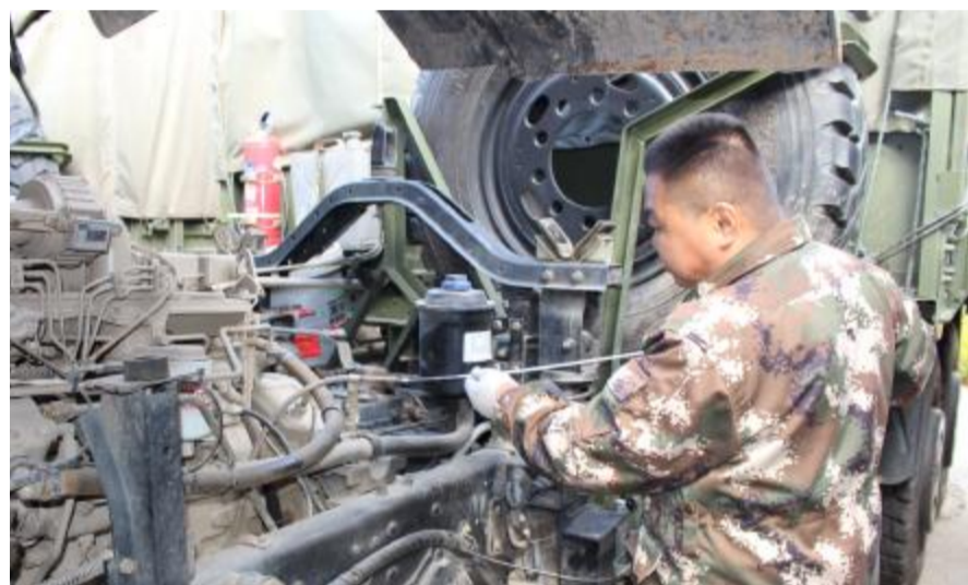
9月13日,大杨树林业局有限公司应急事务处对森林消防运兵车进行维护与保养,排除车辆存在的故障和安全隐患,全力做好秋防工作。

该林场狠抓源头治理,加大检查、巡护工作力度和对采集、入山人员管控力度,切实做到封住山、巡好山,盯住人、管住人;认真履行采集手续,划定活动区域,规定采集时间,实行集体采集,坚决防止随意性采集和零散人员入山;对入山采集人员实行“定人、定车、定点”管理,强化各瞭望塔、巡护队工作职责,加大对山产品采集区域监控力度,全面做好各项应急准备工作,确保一旦发生火情,做到及时预警、及时报告、及时处置。