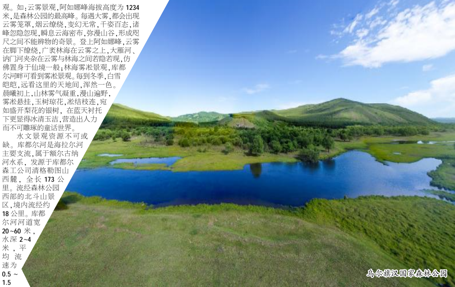
乌尔旗汉国家森林公园