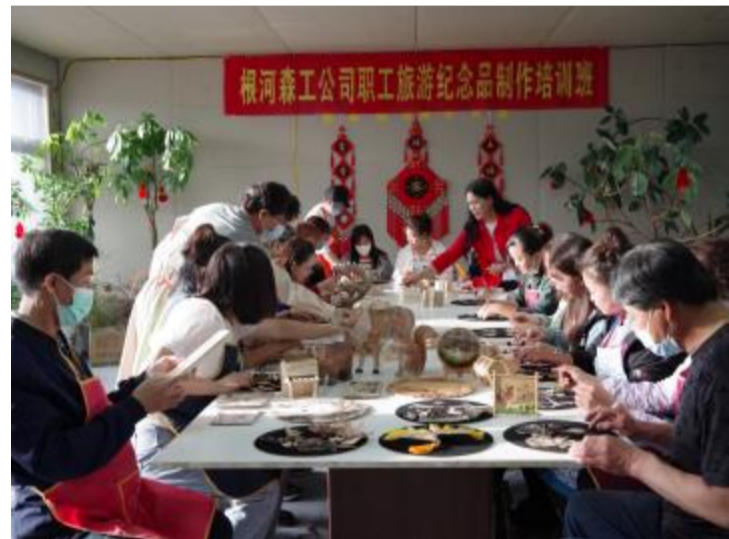
近日,根河森工公司工会举办旅游纪念品制作培训班,从制作桦树皮烙画、贴画等方面培训,提升职工增收致富的技能。

本报讯(通讯员 赵晋华 杜文)近日,内蒙古大兴安岭森林公安局毕拉河分局江西派出所接到辖区村民主动上交的1把弓箭,民警依法对此弓箭进行收缴。警方提醒职工群众,发现枪支弹药、爆炸物品、管制刀具等危险物品主动上交,以免造成意外伤害和社会危害。