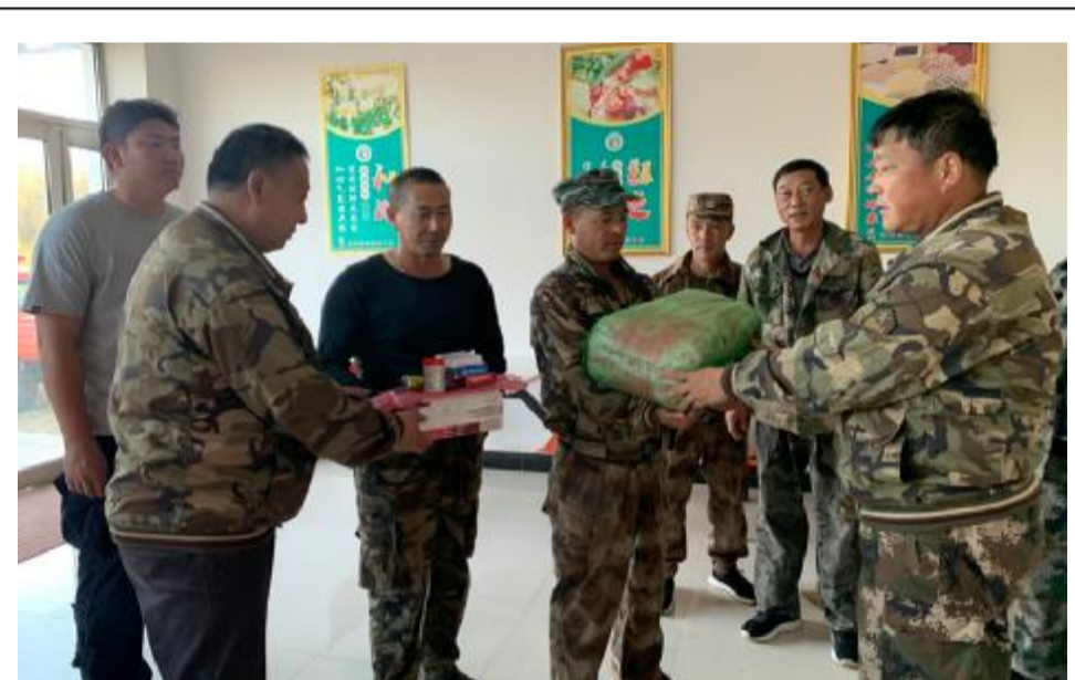
近日,吉文森工公司吉峰林场工会组织人员深入一线,为从事退化林修补任务的职工送去图书,并发放慰问物资。