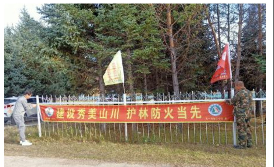
近日,克一河森工公司霍都奇林场悬挂森林防火宣传横幅,安插防火宣传彩旗,营造浓厚秋防氛围。

“一对一”“面对面”的方式,宣传秋季森林防灭火重要性;加强秋收、采山等重点人员的教育宣传,切实做到全覆盖、无死角、无遗漏;在库勒气沟检查站设立宣传台,向过往行人和车辆发放防火宣传单,并对入山人员进行检查,实名登记,确保火源不入山。