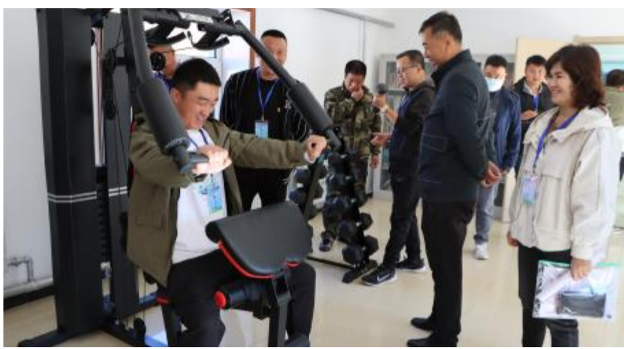
近日,锦尔森公司工会职工代表巡视组到一支沟林场和敖尼尔林场,对厂务公开民主管理工作、职工小家作用发挥以及职工生产生活等事项开展巡视,征集职工的意见建议,发放职工代表专项巡视调查问卷,对职工提出的问题逐一解答;为两个林场送去了图书,丰富了职工文化生活。

该事务处工会组织女职工参加公司举办的第十四届职工运动会、“唱响主旋律 礼赞新时代”大合唱、黎明之夏广场文化周演出、“永远跟党走 舞进新时代”健身操舞表演、诵读和演讲比赛,为女工搭建展示才华的平台。