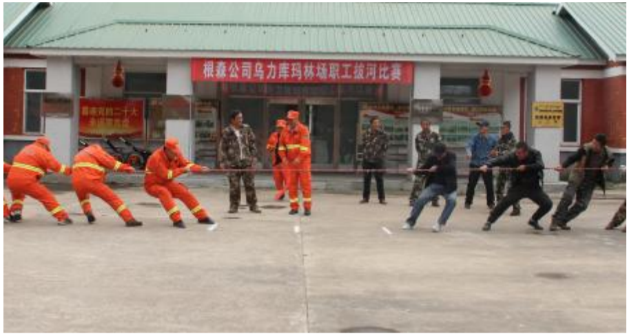
日前,根河森工公司乌力库玛林场工会举办职工拔河比赛,丰富职工文体生活,营造团结和谐的工作氛围。