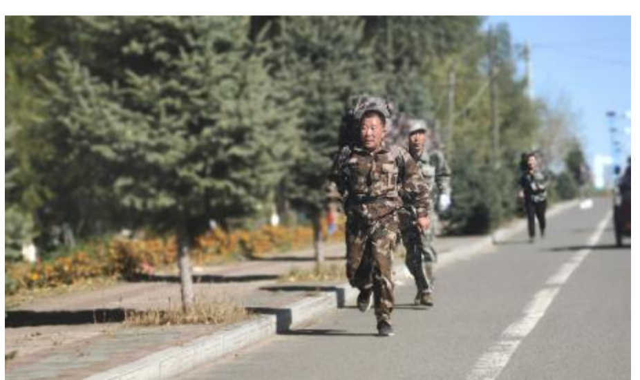
近日,阿龙山森工公司阿北林场举办消防队员体能检测拉练赛,增强扑火队员体能素质,确保拉得出、冲得上、打得赢。