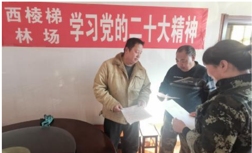
近日,阿里河森工公司西棱梯林场组织职工学习党的二十大精神并交流学习心得。