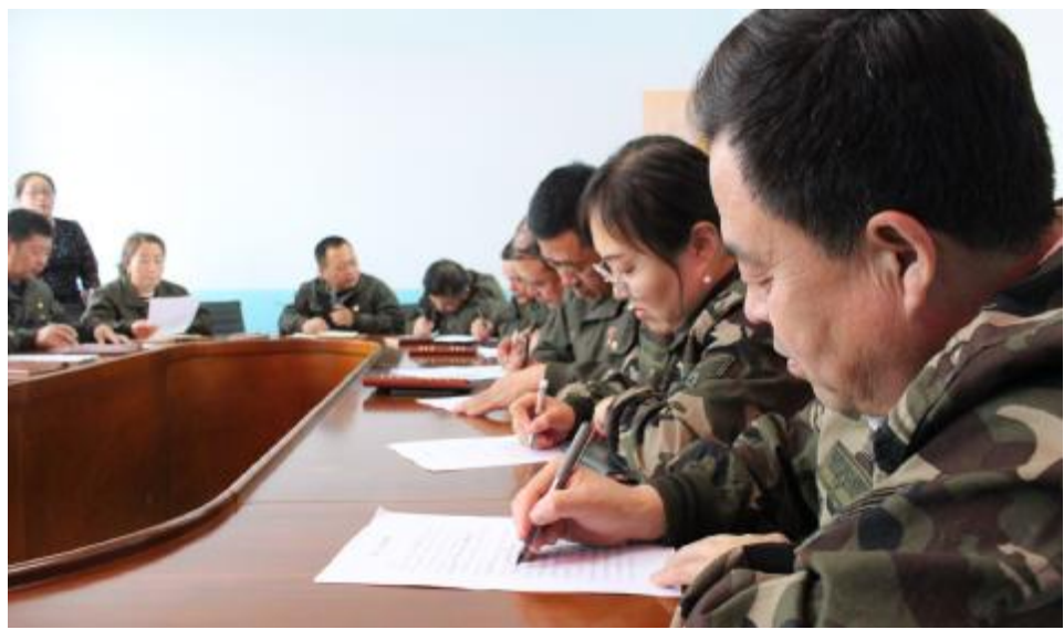
近日,莫尔道嘎森工公司永红林场召开党的二十大精神专题学习答题会,深入学习贯彻党的二十大精神,推动干部职工在履职尽责上见行见效。