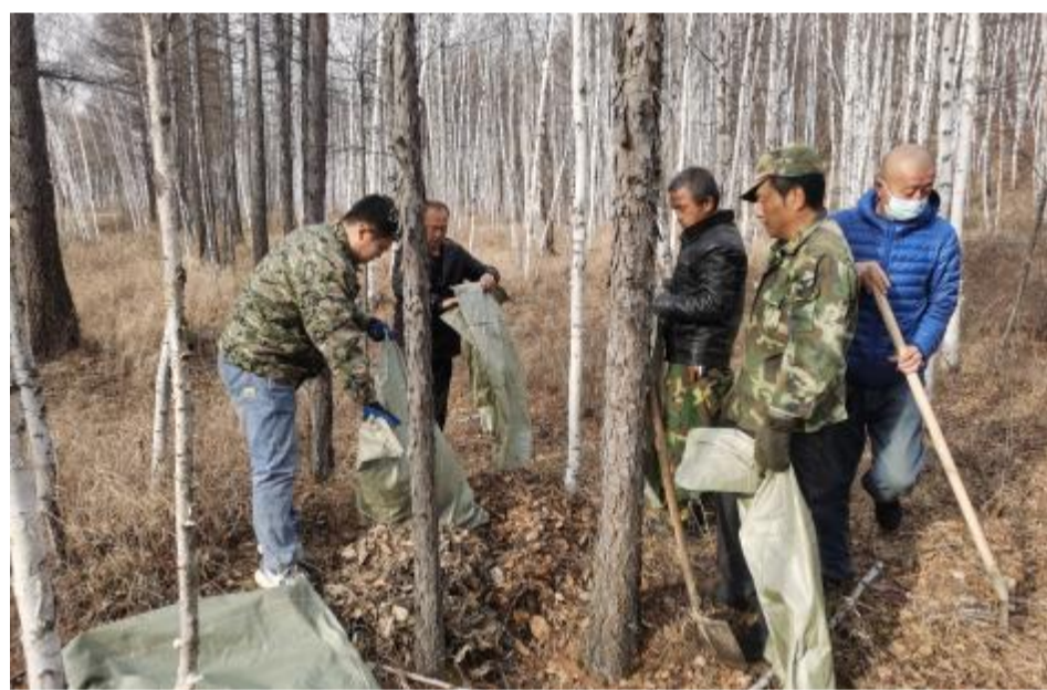
近日,满归森工公司白马林场加强责任区病虫害防治工作,防止桦树黑斑病的发生。

对造林地进行监测,24小时后检查鼠笼和鼠夹时发现,共捕获鼠14只,其中鼠笼捕获6只,鼠夹捕获8只,鉴定鼠种为棕背和红背。现场发现云杉苗被害状有侧枝被害和主干被害两种。防治技术人员对苗木被害造林地采用投放茛菪醇的方法进行了鼠害防治。