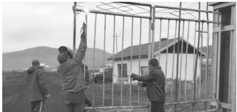
近日,阿龙山森工公司先锋林场组织职工对年久失修铁门进行焊接,消除了安全隐患。