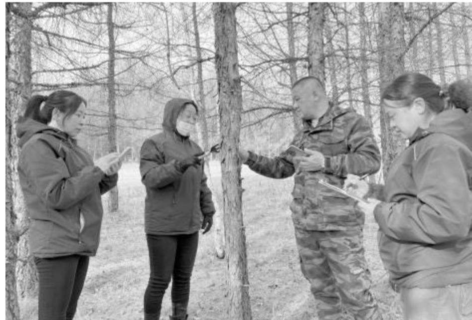
近日,乌尔旗汉森工公司森防站采取专业普查队与林场兼职测报员相结合的方式,选设调查线路 253 条,调查 14378 个松林小班,普查松林面积 475.18 万亩,在调查中发现当年新枯死松树和疑似新枯死松树。

该站对生态功能区内的松林全面踏查,结合夏季落叶松毛虫黑光灯诱集等数据,对部分区域进行重点监测调查。森防人员采取围环和在标准株树冠投影下打样方等方法,调查每平方米落叶层下越冬幼虫数量;在固定标准地扒开枯枝落叶层,查看落叶松毛虫越冬幼虫数量、分布范围,计算有虫株率及虫口密度,并详细做好记录;在固定标准地内随机抽取 30 株树,在树干 1.2 米处围环,环口朝上阻隔幼虫下树,每天记录一次围环内落叶松毛虫幼虫数量,计算出有虫株率及虫口密度。