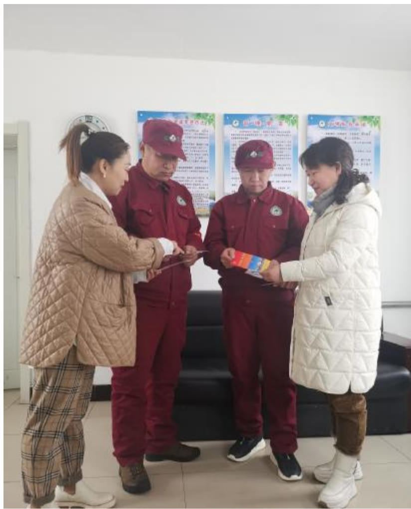
近日,莫尔道嘎森工公司机关党委第十党支部开展“下基层、传精神”主题党日活动,组织党员走进管护站,为管护员讲解党的二十大精神,并送去自制的党的二十大精神学习卡片。

针对基层党组织主题党日活动形式较为单一、主旨不够鲜明的实际,今年,甘河森工公司党委通过党建设施共用、学习培训共抓、服务活动共办、结对互助共扶、特色品牌共创、党建经验共享等形式,不断丰富主题党日的载体内涵,构筑了组织、宣传、服务、凝聚党员群众的主阵地。各支部还重点围绕理论学习、中心工作、民主议事、服务群众、党性锻炼等方面开展主题党日活动,形成了严肃活泼、规范有序、务实管用的活动程序,主题党日活动仪式感更“强”了,“党味”更“浓”了。