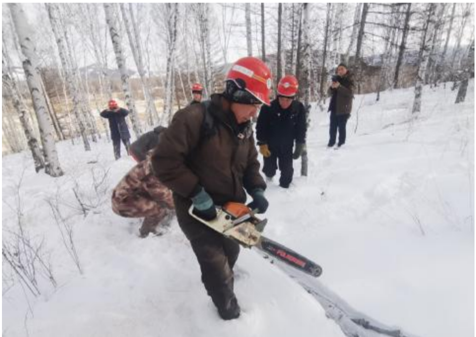
近日,阿尔山森工公司古尔班林场组织人员深入生产一线,检查指导安全生产工作,为森林抚育保驾护航。