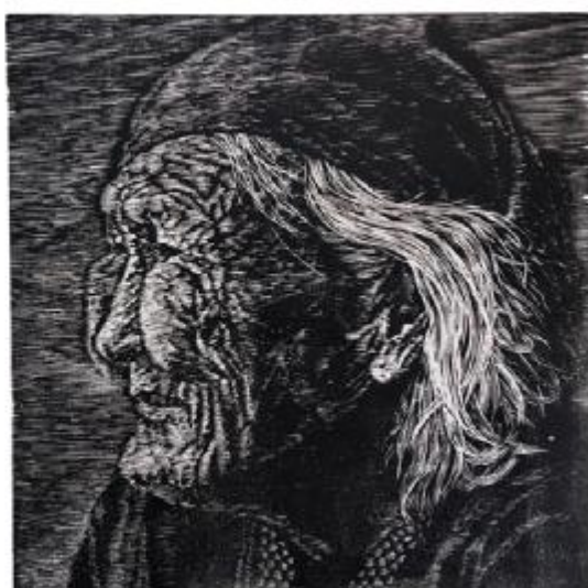
△ 《使鹿部落的守护者》