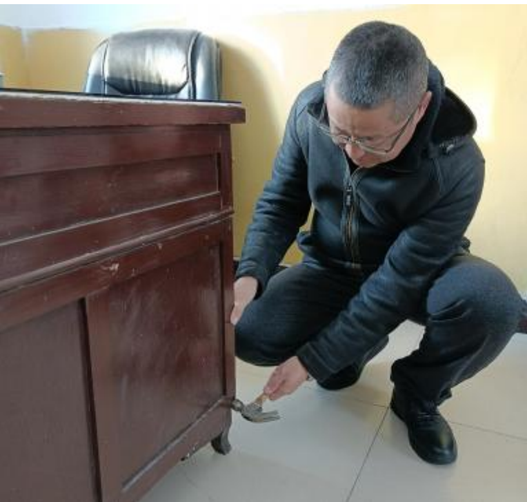
近日,阿龙山森工公司先锋林场组织职工将办公楼前的台阶铺上地毯,维修了办公设备,使办公环境焕然一新。 图为职工正在修复损坏的办公桌。

深刻理解内涵,精准把握外延,做到学深悟透、融会贯通。同时,该林场党支部结合工作实际,为不能参加集体学习的管护站党员干部送去党的二十大精神学习资料,方便管护员在工作中学习,确保将党的二十大精神传递给每一个职工群众。