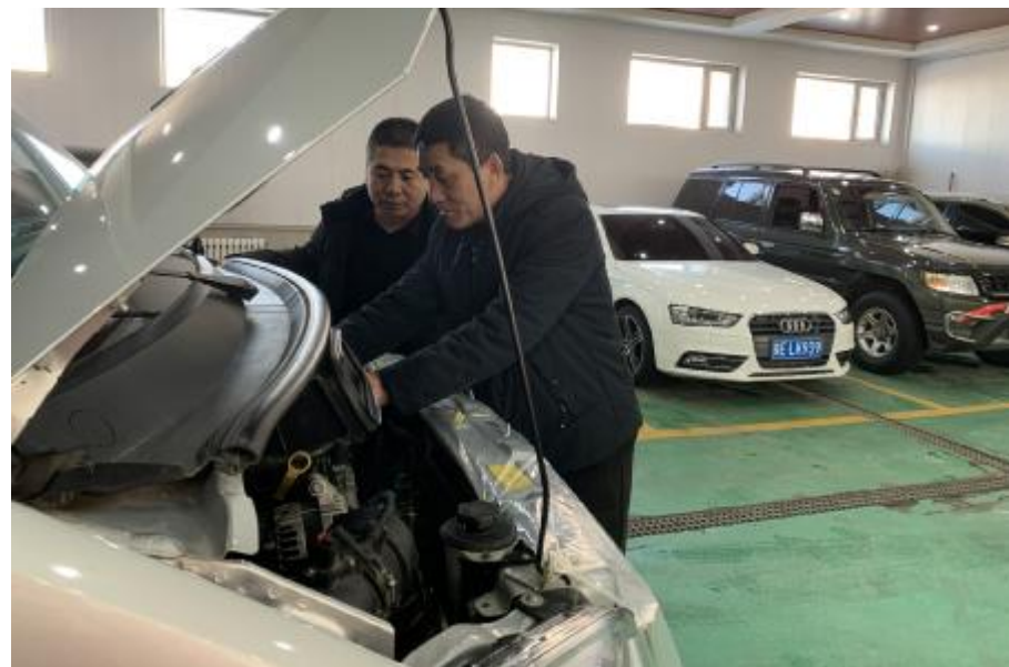
近日,阿龙山森工公司产业事业处开展“比技能、强素质”驾驶员技能竞赛。图为驾驶员在参加车辆故障处理项目竞赛。