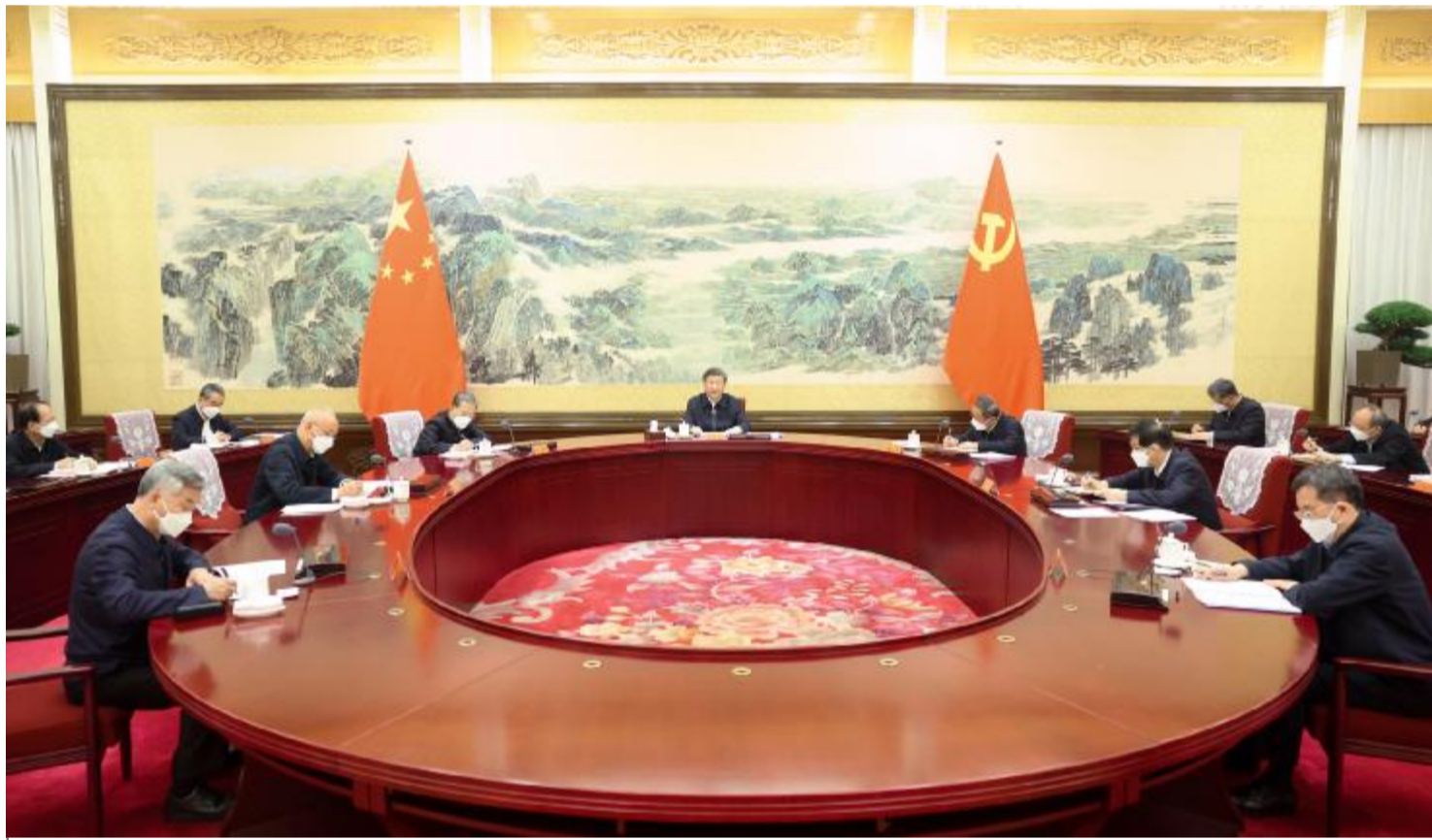
12月26日至27日，中共中央政治局召开民主生活会，中共中央总书记习近平主持会议并发表重要讲话。