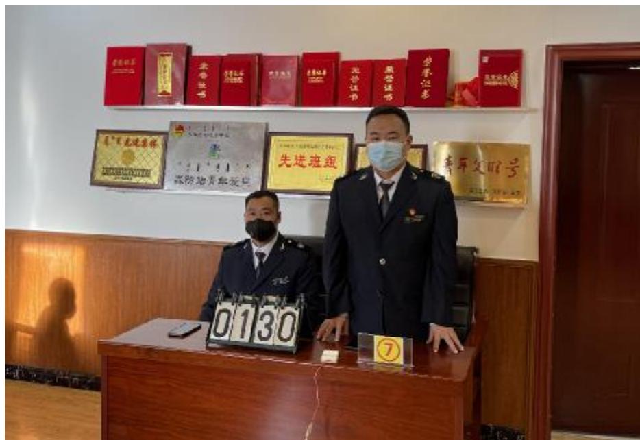
12月15日,阿尔山森工公司森防站举办林业有害生物防控知识竞赛,达到以赛促学的目的。