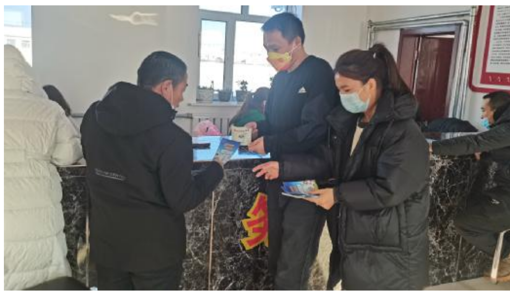
近日,毕拉河林业有限公司中心苗圃开展禁毒宣传活动,让职工群众了解毒品的危害。图为工作人员发放禁毒宣传手册和宣传册。