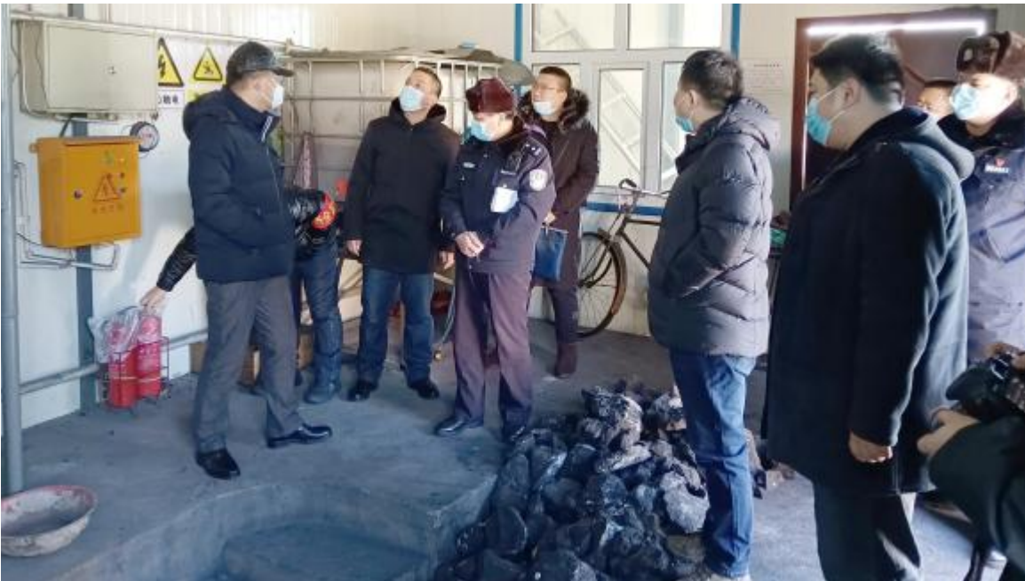
近日，库都尔森工公司与内蒙古大兴安岭森林公安局库都尔分局组成联合检查组，对各单位进行安全检查，消除安全隐患。

该公司党委成立网络安全和信息化领导小组，加强公司网络舆情的预警防范和监控引导，对出现的不良信息、不实报道，做到快速稳妥处理和回应；建立新闻稿件审批制度，畅通基层信息上报渠道，确保第一时间获得并掌握基层工作动态；加强网评员队伍建设，规范网上传播秩序，切实维护网络意识形态安全；对基层党支部微信、QQ工作群进行登记造册备案，确保宣传阵地健康、规范、有序。