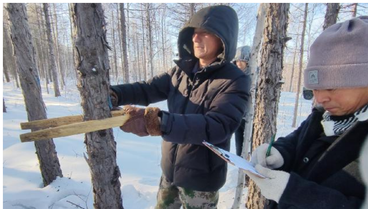
日前,阿龙山森工公司森防队开展了“三类调查设计”大比武活动。队员分成3个竞赛小组,参加GPS定点、作业区面积测量、标准地调查、每木检尺4个项目的角逐,提升了队员的业务技能。图为队员在测量树径。