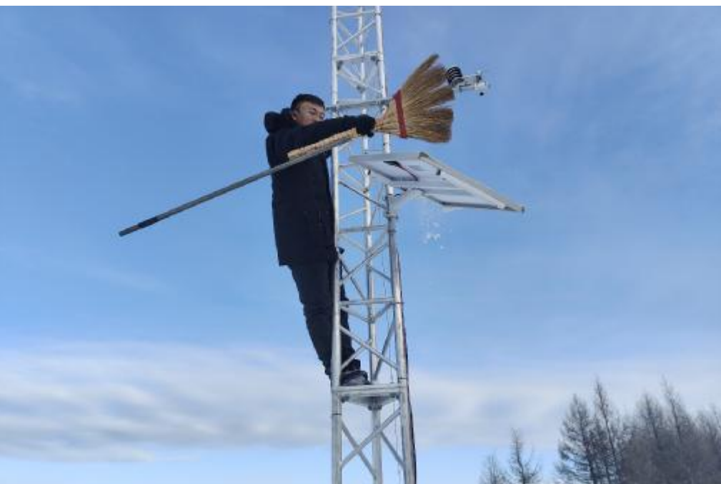
近日,乌尔旗汉森工公司自然保护地管理处组织职工清理太阳能板上覆盖的积雪,查看电箱供电设备,保证湿地气象监测系统正常工作。

为重要谈话提醒对象,要求干部职工增强廉政守纪意识,严格遵守廉洁自律有关规定,绷紧纪律之弦,严防违规接受宴请等节日期间易发多发问题和收受电子红包、杜绝酒驾、醉驾,远离赌博,确保过一个清廉、平安、祥和的春节。 该林场党支部通过赠送“廉”字中国结,观看廉政主题纪录片《鉴史问廉》,签订党员干部廉洁过节承诺书、制作廉洁手机壳等,引导党员干部明高线、知底线,自觉抵制不良风气,形成廉洁过节的良好风尚。