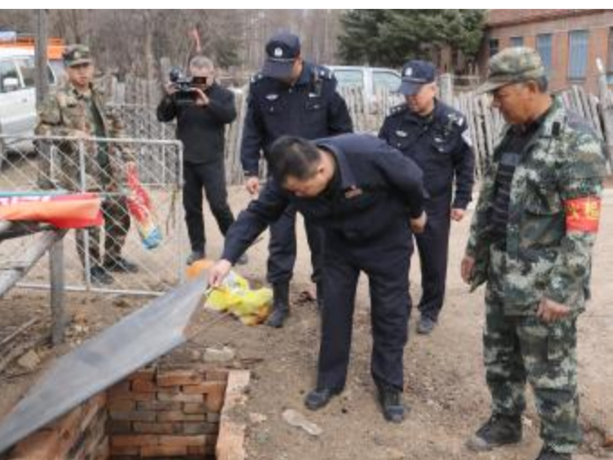
进入春防紧要期,吉文森工公司与内蒙古大兴安岭森林公安局吉文分局组成武装“三清”专项行动组,深入各林场所属沟系、河流、矿区、农业点、养殖点、临时作业点等重点危险区域进行地毯式排查,确保清理工作全覆盖无死角。图为专项行动组检查灰坑燃烧剩物。