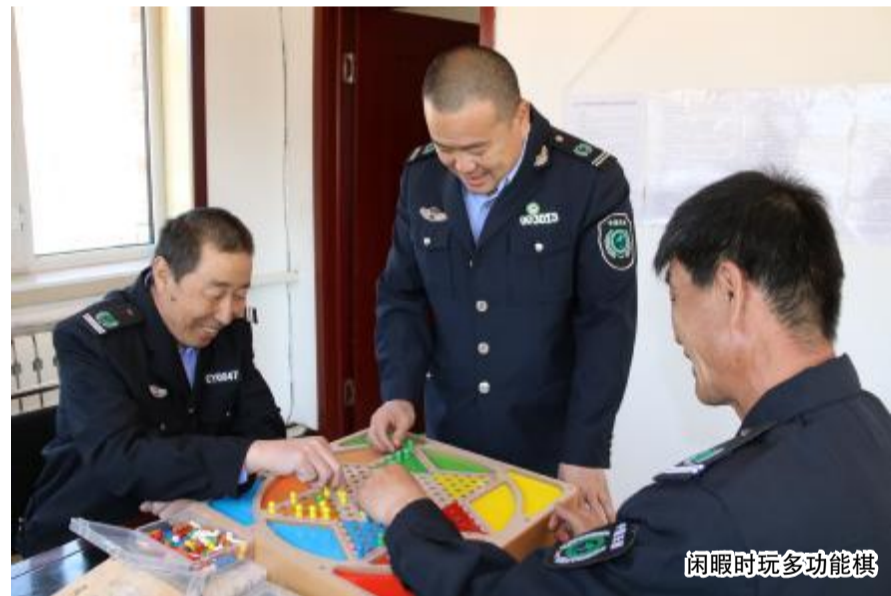
闲暇时玩多功能棋