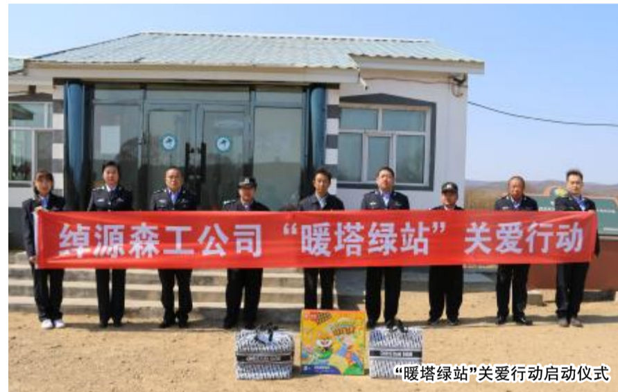
“暖塔绿站”关爱行动启动仪式