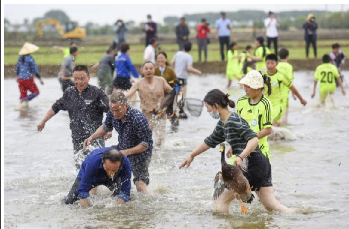
5月30日,在淮安市洪泽区岔河镇,人们在插秧节上参加抓鸭比赛。

自治区发展改革委聚焦关键领域和薄弱环节加大补短板力度,全力推动重大项目建设,持续扩大有效投资,支撑经济平稳健康发展。前4个月,全区固定资产投资(不含农户)同比增长37.2%,高于同期全国平均水平32.5个百分点。各地坚持项目为王、环境是金,一门心思聚产业、一刻不停推项目、一以贯之优环境,推动重大项目建设跑出“加速度”。