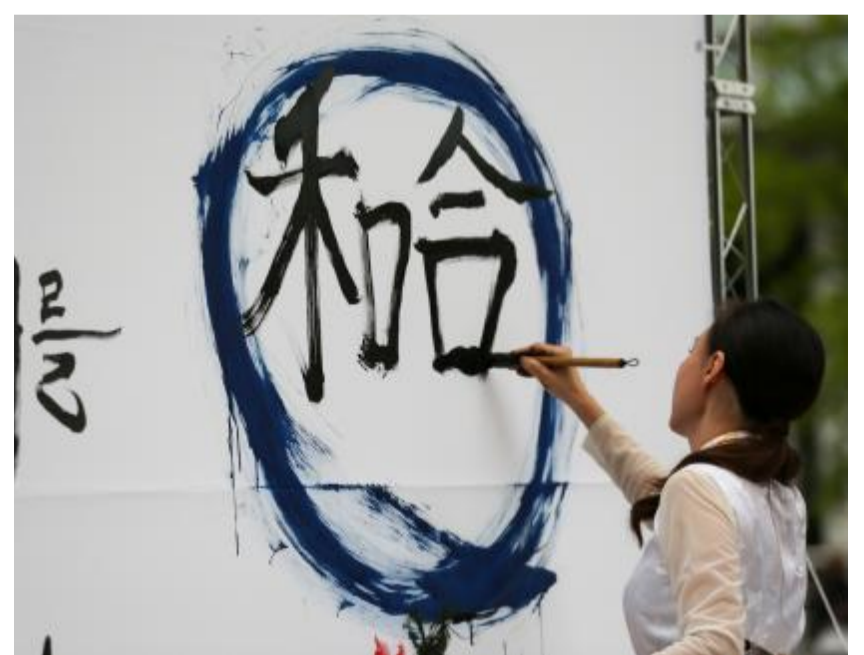
5月30日,在韩国首尔举办的“中日韩合作之日”庆祝活动中,表演者进行中日韩精神——2023年度汉字“和合”书法表演。

韩联社29日报道,韩方当天就朝鲜计划发射军事侦察卫星一事提出警告,并敦促朝方立刻撤销发射计划。