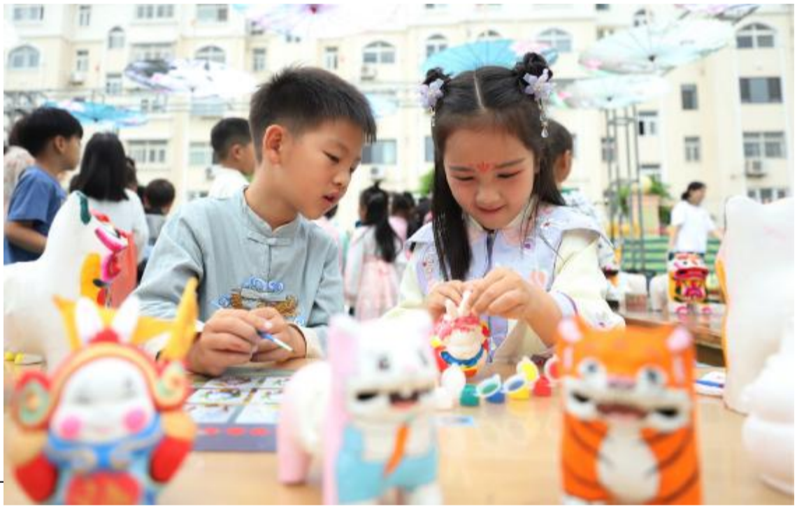
5月30日,在山东省青岛西海岸新区滨海新村幼儿园,小朋友在制作兔儿爷手工作品。