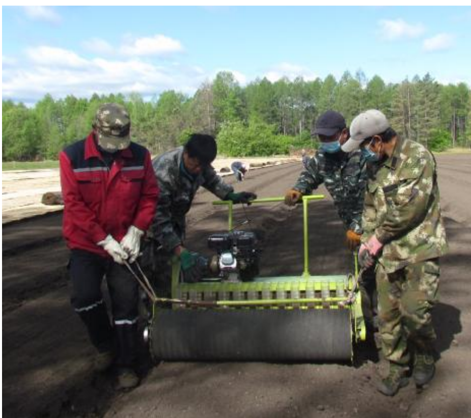
近日,古文森工公司中心苗圃新播云杉15亩、落叶松5亩、榆树2亩、金莲花10亩,为造林苗木储备和发展林下经济打下坚实基础。图为职工在用播种机播种云杉。

夏日的内蒙古绰尔雅多罗国家湿地公园万物繁茂,青草、蓝天、碧水交相辉映,一幅生态优美画卷正在这里徐徐铺展。