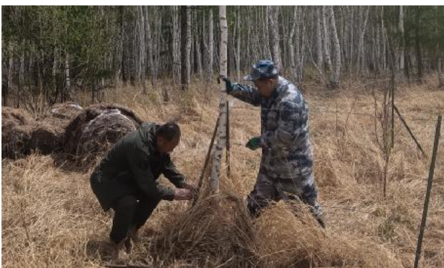
近日,库都尔森工公司森防站在生态功能区区内设置招引架,为捕食鼠兔类的鹰类提供落脚点和栖息环境,达到保护生态、防治鼠兔害的目的。