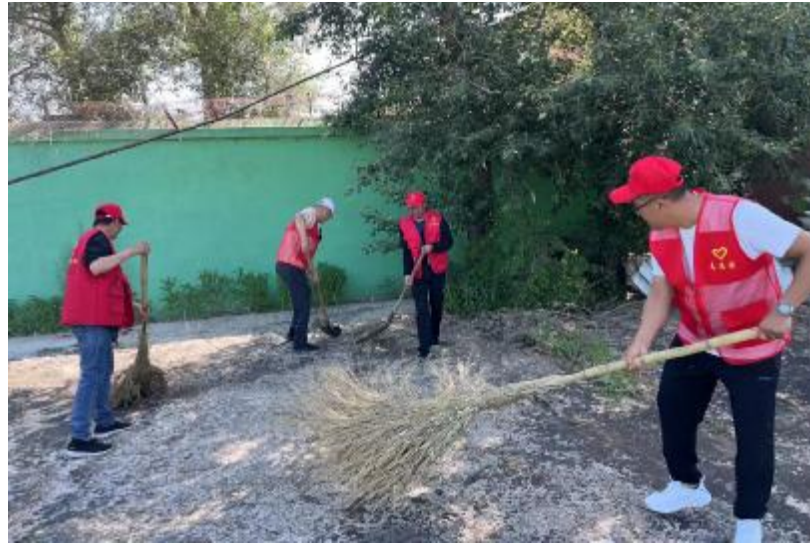
近日,内蒙古大兴安岭森林调查规划院开展了青年志愿者活动,大家顶着烈日把篮球场各个角落打扫得干干净净,为职工开展体育活动创造了良好的环境。