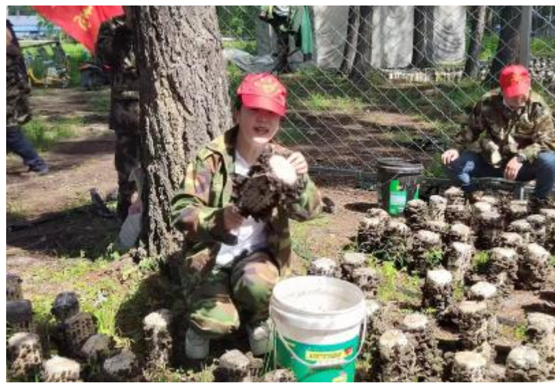
近日,克一河森工公司诺敏林场志愿服务队深入黑木耳种植户家中,帮忙采摘黑木耳,解决了林场职工的燃眉之急。