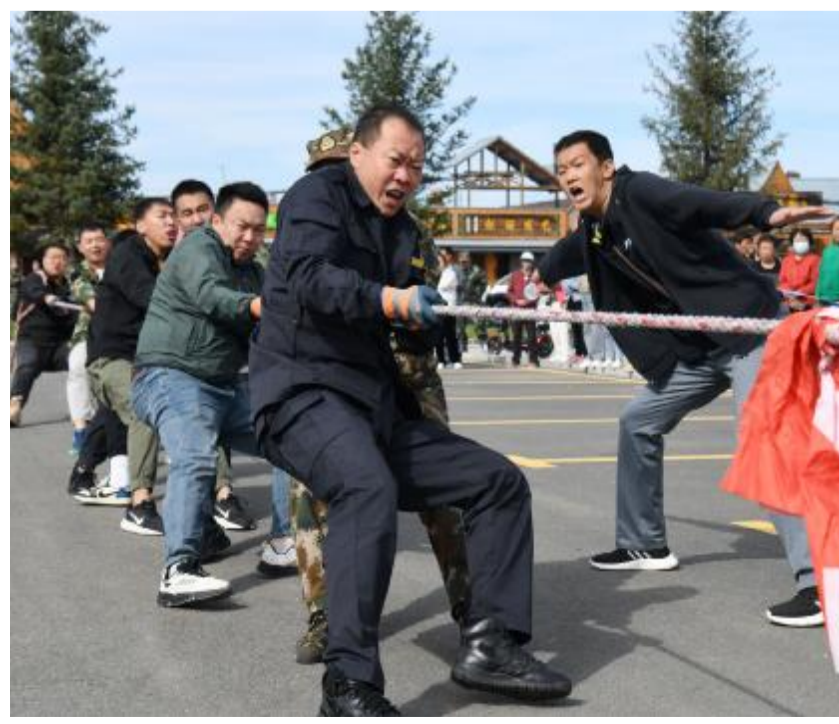
8月25日,图里河森工公司举办“凝心聚力跟党走 团结奋进新征程”2023年职工拔河比赛,来自18个基层单位的180名职工参加了比赛,充分展示了公司干部职工积极向上的精神风貌。