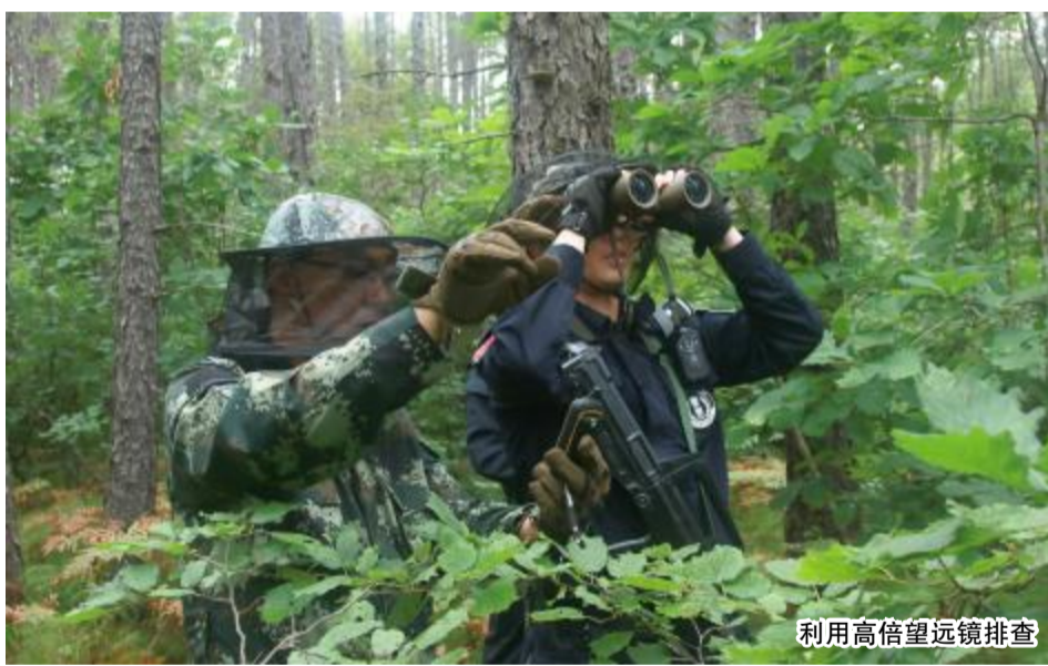
利用高倍望远镜排查