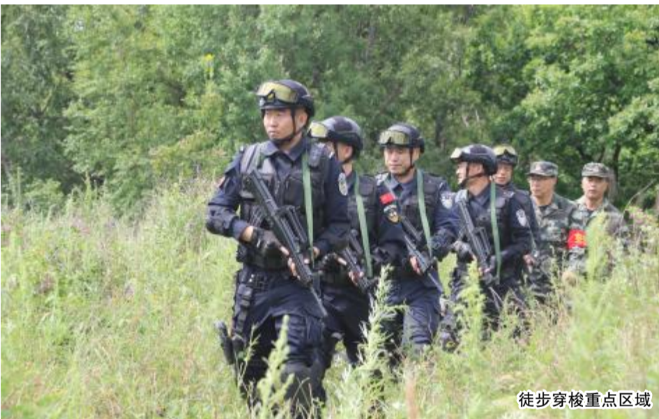
徒步穿梭重点区域