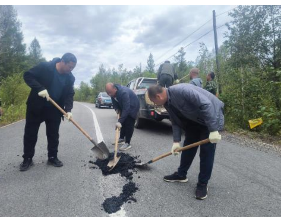
近日,阿里河森工公司公路养护管理中心对公司通往相思谷景区的公路破损路面坑槽进行集中治理,保障往来车辆通行安全,提高道路安全指数,延长公路使用寿命。

本报讯(通讯员 王春艳)近日,金河森工公司嘎拉牙林场党支部开展党员干部和重点岗位、重要环节廉政风险防控“回头看”工作。 该林场党支部把开展“回头看”工作作为一项政治任务,查找党员干部和重点岗位、重要环节存在的廉政风险点,绘制了