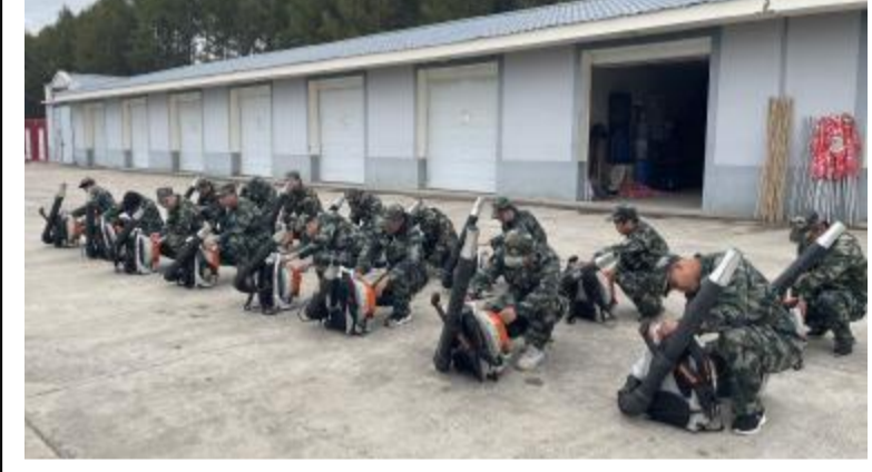
近日,毕拉河林业有限公司应急事务处组织人员对已维护的车辆、通信设备、扑火机具等装备进行检查,确保完好率达100%,为秋季森林防火工作打下坚实基础。