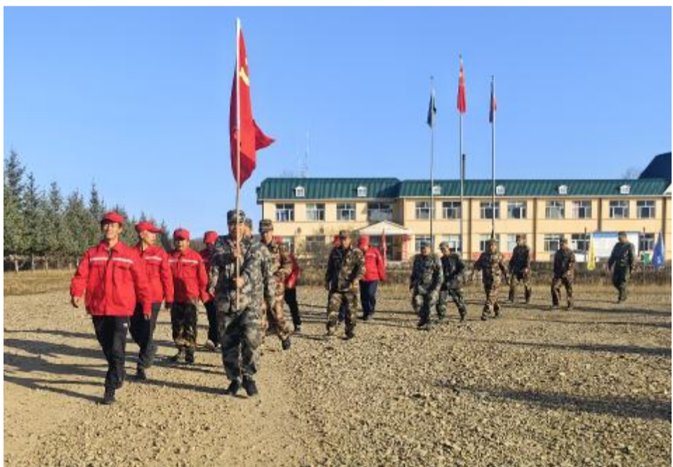
10月9日,根河森工公司下央格气林场举办“健步同行·趣享运动”职工徒步走竞赛,提高职工身体素质,激发职工的工作热情。

可直接目测,远距离借助望远镜及利用移动端手机监测 APP 进行监测,实时更新工作动态和监测数据,做到及时发现、及时报告、及时防控。在监测普查工作中,对尚未完全枯死或刚枯死的松树,砍木片或截圆盘的取样方法带回实验室检测,经检测未发现松材线虫病。