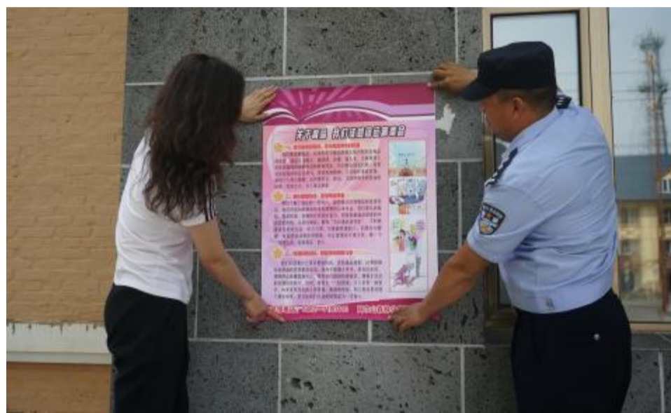
近日,阿龙山森工公司森防站联合伊尔施边境派出所开展禁毒宣传活动,通过张贴宣传海报、向过路行人发放禁毒宣传资料、讲解禁毒知识等方式,提高民众对毒品危害性的认识。

该林场党支部结合不同人群精准开展“点单式”志愿服务活动,倾听群众心声,了解诉求,真正把关心关爱送到群众身边,提升职工群众的获得感、幸福感和安全感。