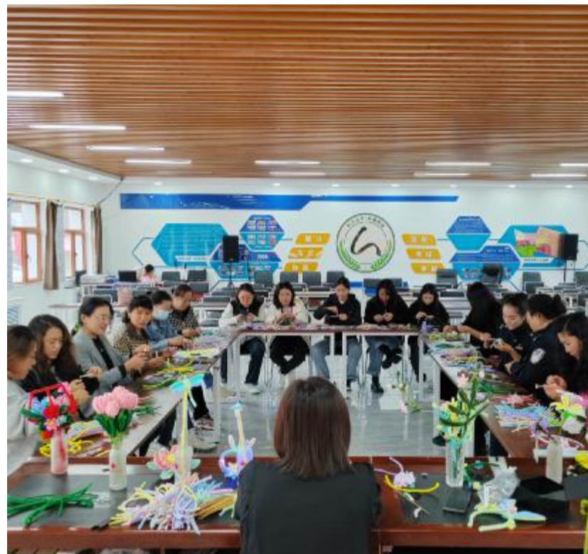
近日,阿龙山森工公司森防站联合阿山市兴林社区开展手工艺品制作活动,带领职工学习制花的基本制作方法,让职工感受非遗作品的独特美感 and 艺术价值。

本报讯(通讯员 刘广明)近期,阿里河森工公司西楼梯林场开展“珍爱生命 远离毒品”禁毒宣传活动,通过发放宣传传单、张贴海报、制作展板、志愿者讲解等方式,向群众宣传毒品的危害性,增强群众防毒拒毒意识。