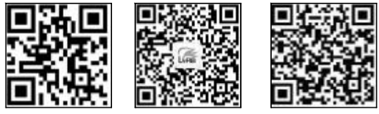
绿网 林海日报官方微信 林海日报官方微博