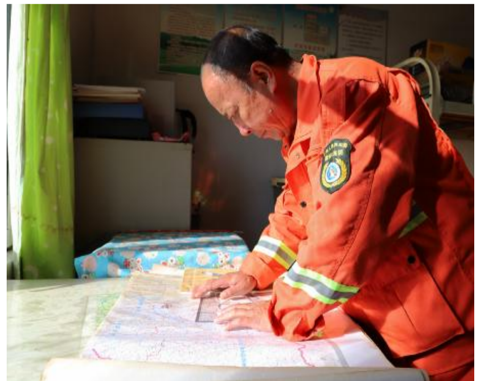
10月9日，库都尔森工公司应急事务处举办瞭望员定位技术比赛，夯实瞭望员业务基础，为秋季森林防火工作提供保障。