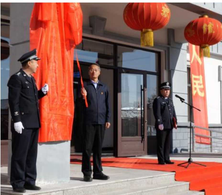
10月10日,内蒙古大兴安岭森林公安局图里河分局举行新办公楼搬迁揭牌仪式。据了解,图里河分局新办公大楼建筑面积2236平方米,设办公室59间。

本报讯(通讯员 高春)进入秋防期以来,库都尔森工公司新帐房林场组织防火人员开展负重长跑、俯卧撑等体能训练,强化队员体能素质,提升应对森林火灾的战斗力。