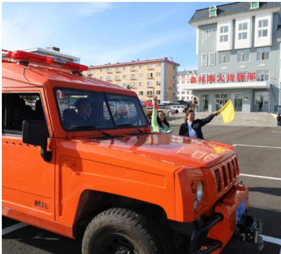
近日,伊图里河林业有限公司工会开展驾驶员岗位练兵技能比武,公司各单位30余名驾驶员参加比武,提高了驾驶员技术水平。

近日,毕拉河林业有限公司应急事务处开展全地形运兵车维护保养工作,检查了车辆的运行状况,提高队伍的应急响应、抢险救灾能力。