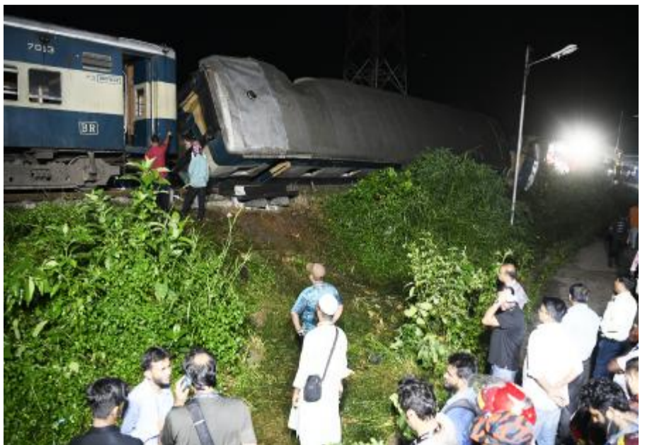
10月23日，人们聚集在孟加拉国吉雷雷甘杰地区火车相撞事故现场。孟加拉国警方23日确认，吉雷雷甘杰地区当天发生一起两列火车相撞事故，已造成至少16人死亡，100余人受伤。