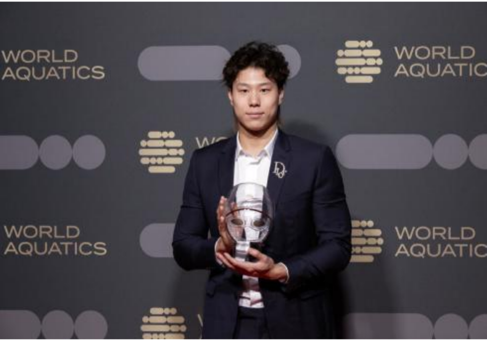
10月23日，在匈牙利布达佩斯，覃海洋在颁奖典礼上。当日，世界泳联年度最佳游泳运动员评选在匈牙利首都布达佩斯揭晓，中国选手覃海洋获最佳男子游泳运动员，澳大利亚选手麦基翁获最佳女子游泳运动员。