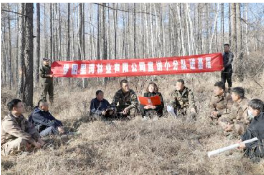
连日来,伊图里河林业有限公司宣讲团深入各基层单位、山场一线,宣讲《国务院关于推动内蒙古高质量发展奋力书写中国式现代化新篇章的意见》,引导党员干部牢记习近平总书记的殷殷嘱托,争做履职尽责、吃苦耐劳的新时代务林人,在谱写中国式现代化内蒙古新篇章中贡献力量。

特色小镇创建满归自治区级旅游度假区。依托区位优势、生态资源和特色文化,建设了食用菌培育研学基地、宝格偃松和冰川遗迹景区、贝尔茨河国家湿地公园展馆等重点项目,打造独立景区景点15个,开辟绿色旅游线路100多公里,培育形成观光游览类、运动健身类、文化体验类、康养度假类等休闲度假产品。并通过推出春游杜鹃、夏游养生、秋游采摘、冬游冰雪的四季旅游项目和举办“红豆采摘节”“高寒摄影节”“冰雪艺术节”等文化主题活动及“山地自行车邀请赛”“雪地汽车拉力赛”,形成自然景观和人文景观有机融合、内容丰富的旅游资源。