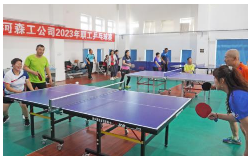
10月27日,克一河森工公司举办2023年职工乒乓球比赛,旨在丰富职工群众文化生活,增强队伍的凝聚力和向心力,来自各基层单位及乒乓球协会的100余人参赛。