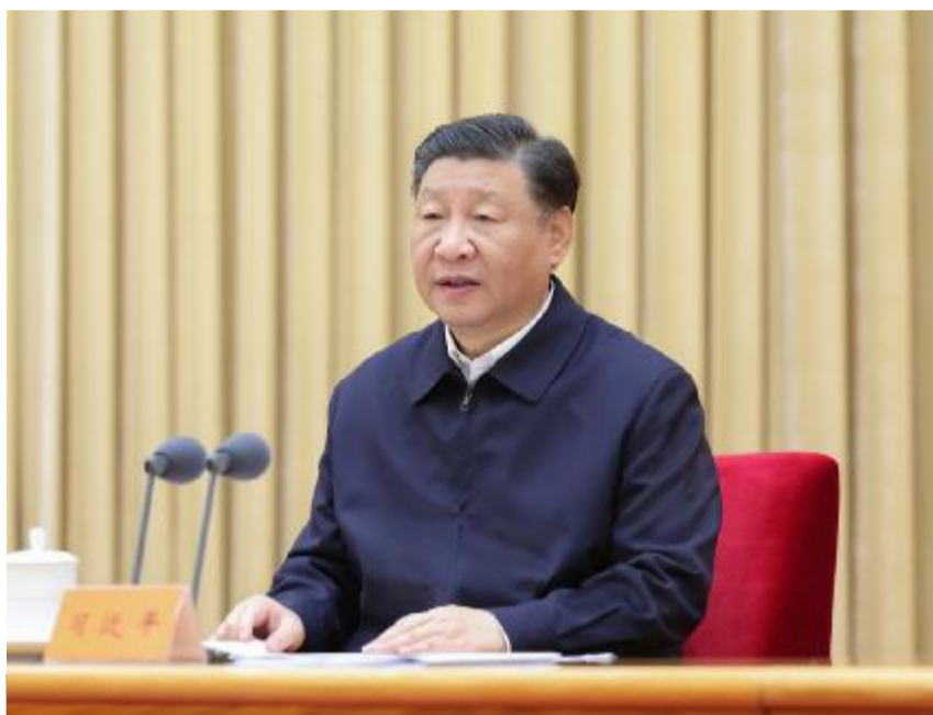
10月30日至31日,中央金融工作会议在北京举行。中共中央总书记、国家主席、中央军委主席习近平出席会议并发表重要讲话。

会议指出,高质量发展是全面建设社会主义现代化国家的首要任务,金融要为经济社会发展提供高质量服务。要着力营造良好的货币金融环境,切实加强重大战略、重点领域和薄弱环节的优质金融服务。始终保持货币政策的稳健性,更加注重做好跨周期和逆周期调节,充实货币政策工具箱。优化资金供给结构,把更多金融资源用于促进科技创新、先进制造、绿色发展和中小微企业,大力支持实施创新驱动发展战略、区域协调发展战略,确保国家粮食和能源安全等。盘活被低效占用的金融资源,提高资金使用效率。做好科技金融、绿色金融、普惠金融、养老金融、数字金融五篇大文章。要着力打造现代金融机构和市场体系,疏通资金进入实体经济的渠道。优化融资结构,更好发挥资本市场枢纽功能,推动股票发行注册制走深走实,发展多元化股权融资,大力提高上市公司质量,培育一流投资银行和投资机构。促进债券市场