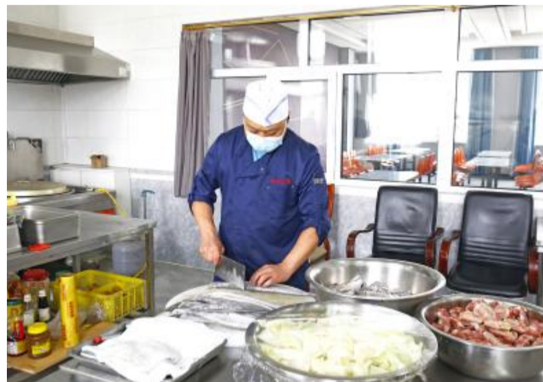
近日,阿尔山森工公司应急事务处开展“亮厨艺强技能展风采”岗位技能比武,展示了后勤保障人员良好精神风貌过硬业务技能。

采取线上与线下教育相结合的方式,切实抓好党员干部教育;以铸牢中华民族共同体意识为主线,使“三个离不开”“四个与共”“五个认同”理念融入广大职工心间,成为自觉行动;把学理论、学先进、学业务有机结合,与林场生态建设、产业发展、改革管理等主责主业相结合,以党建赋能高质量发展。