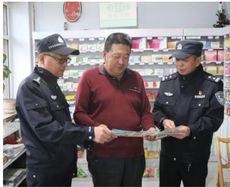
连日来,内蒙古大兴安岭森林公安局满归分局派出所民警深入辖区开展反诈宣传活动,确保职工群众生命财产安全。