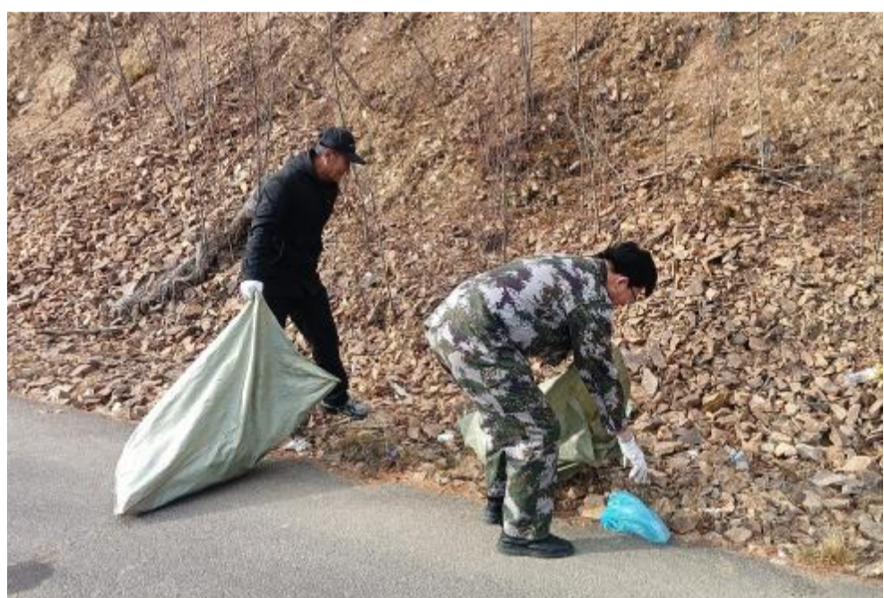
10月30日,阿龙山森工公司塔朗空林场党支部开展场区环境整治活动,组织职工收捡林场解放路和远山卫生责任区的白色垃圾,创造整洁的工作生活环境。