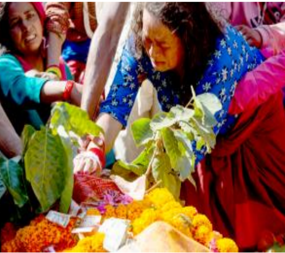
11月5日,在尼泊尔鲁古姆西区,人们因亲人的离去悲痛不已。尼泊尔警方 4 日说,尼西部 3 日午夜发生的地震已造成 157 人死亡,另有约 170 人受伤。