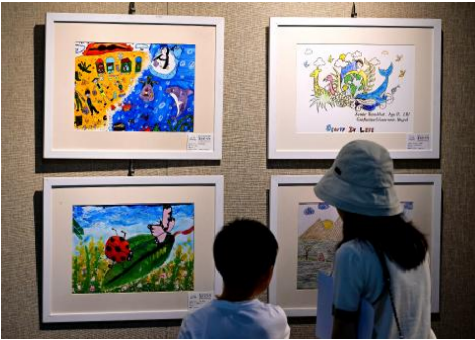
11月5日,小朋友和家观赏儿童画展。

国家发展改革委固定投资司司长罗国三表示,此次增发国债项目原则上应为“十四五”规划、国务院及国务院有关部门批复的重点专项规划和区域规划,或省级规划和相关实施方案中的重点项目。“项目应论证充分,具备一定前期工作基础,严格落实各渠道建设资金,确保资金拼盘完整闭合。”他说。