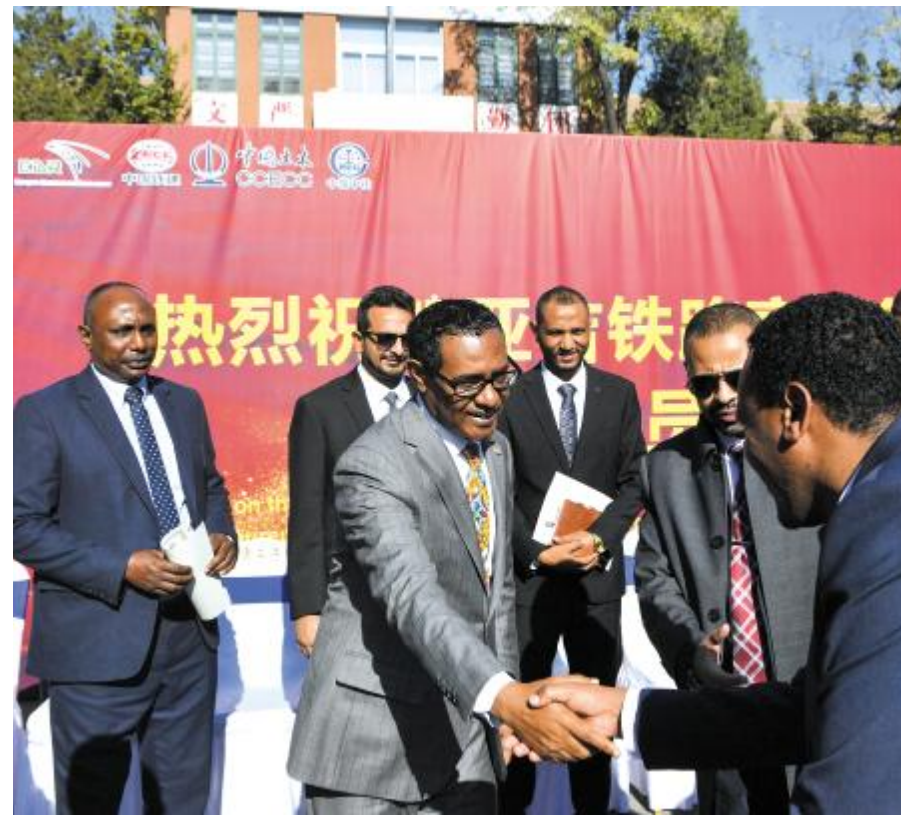
11月7日，在天津铁道职业技术学院，埃塞俄比亚驻华大使塔费拉(前左)向结业学员表示祝贺。 当日，首届亚吉铁路高层管理人员培训在天津铁道职业技术学院举行结业仪式。本届培训共有来自埃塞俄比亚、吉布提的35名技术、人事等高管参加，相继完成了为期两个月铁路运营方面的知识培训，未来将致力于亚吉铁路运营服务，助力当地经济社会发展。 作为非洲首条跨国电气化铁路，亚吉铁路于2018年1月正式开始商业运营。