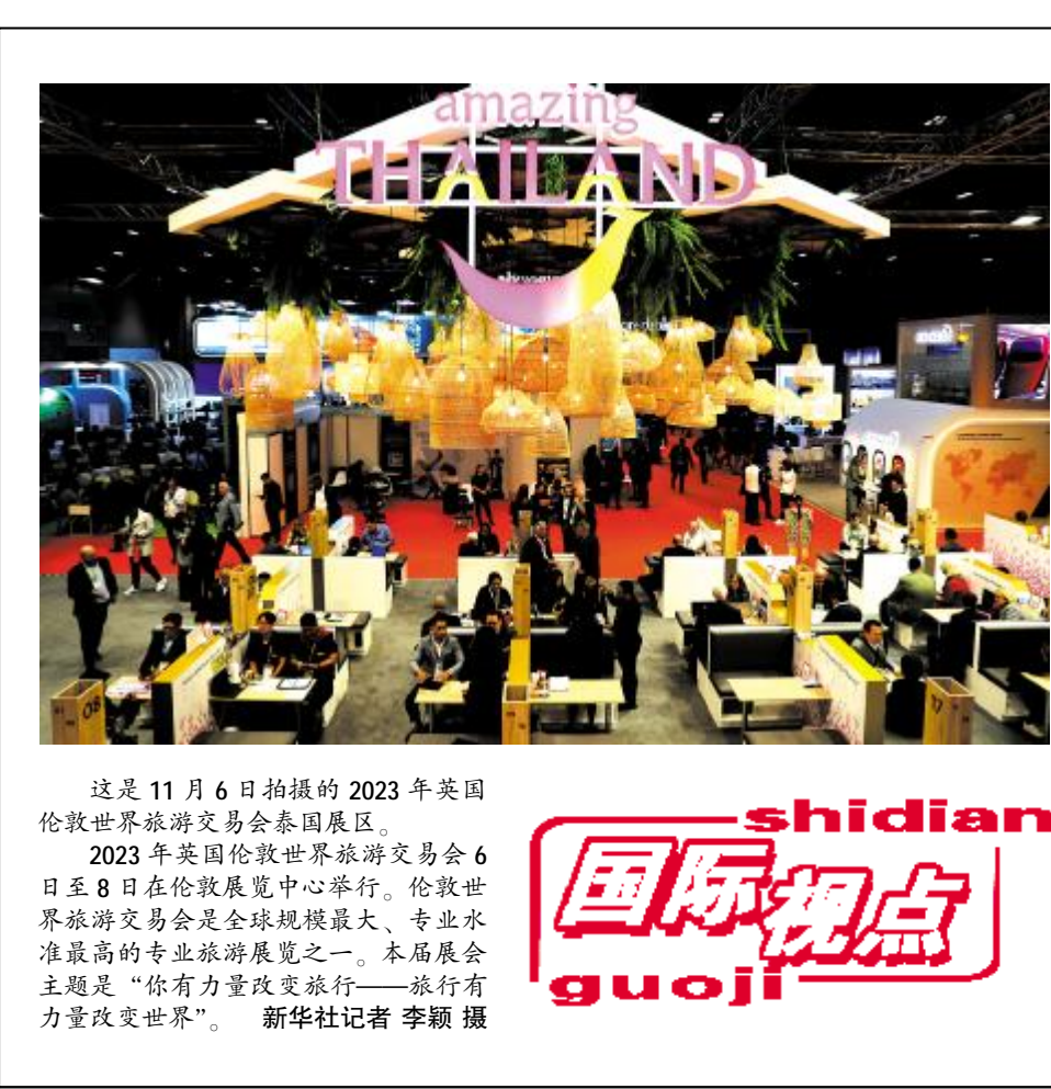
这是11月6日拍摄的2023年英国伦敦世界旅游交易会泰国展区。 2023年英国伦敦世界旅游交易会6日至8日在伦敦展览中心举行。伦敦世界旅游交易会是全球规模最大、专业水准最高的专业旅游展览之一。本届展会主题是“你有力量改变旅行——旅行有力量改变世界”。

导推动群众自治化解矛盾，探索形成了“以情动人、以理服人、以法喻人”预防化解老旧小区矛盾纠纷工作法。包头市土默特右旗通过建立三级信访代办服务机构，建强信访代办服务网络，规范信访工作流程，用好“两委会议”、领导接访下访、信访联席会议、访调对接等机制，形成了预防化解涉信访矛盾纠纷工作法，初信初访化解率进一步上升，重复访数量大幅下降。兴安盟扎赉特旗巴达胡镇以化解邻里纠纷为切入点，推动源头治理，通过日常排查、集中排查等方式实现矛盾纠纷发现在早、防范在先，建立镇级联动调解中心，组建巡回调解专班、例会协商多元化疑难复杂矛盾，探索出了邻里纠纷“精准排、联动调、例会商”工作法。