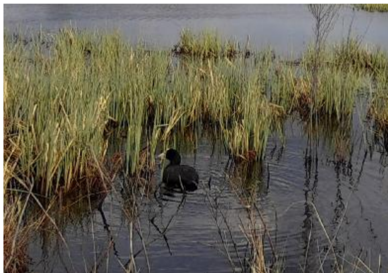
近日,绥尔森工公司自然保护区管理处整理回收绥尔雅多罗国家湿地公园内红外相机数据,首次发现了国家二级保护动物白骨顶影像。

“万物各得其所和以生,各得其养以成。”朱鹮种群恢复,是中华大地生物多样性持续改善的缩影。近年来,大熊猫、藏羚羊等一批珍稀动物喜提“降级”,曾经野外消失的麝鹿总数突破8000只,亚洲象野外种群数量从上世纪80年代的180头增到目前的300头左右,巧家五针松已从