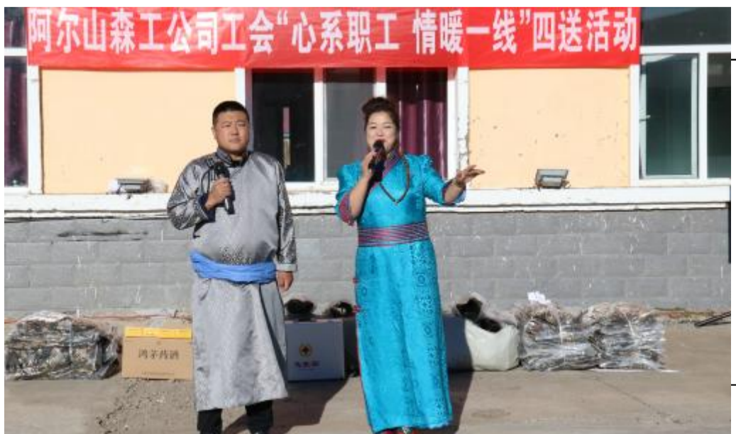
近日,阿尔山森工公司开展“心系职工 情暖一线”四送活动,一名女工正在舞台上演唱。潘文晶 张静 摄

搭建擂台,突出业务能力“比”。该公司党委以能力素质比赛、工作成果展示、观摩互鉴、述职评议为主要方式,开展“党组织书记比武争星”、“党务工作与中心工作融合工作案例”评选、“优秀党课”评选、“优秀组织生活工作方案”评选等活动,比学争优成果,比创新创先特色亮点,全面检验、提升“大学习”“大练兵”效果,营造争先创优的浓厚氛围。