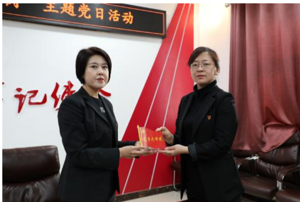
近日,伊图里河林业有限公司机关党委开展“党员先锋岗”主题党日,为19名党员颁发“党员先锋岗”标牌,营造“比、学、赶、超”的浓厚氛围。

准规范,既防止问责乏力,也防止问责泛化;充分运用监督执纪“四种形态”,把监督执纪问责做深做细做实;推动信访举报“存量清零、增量随清”,深化受理办理、统计分析、督查督办,实现政治效果、纪法效果、社会效果的有机统一。