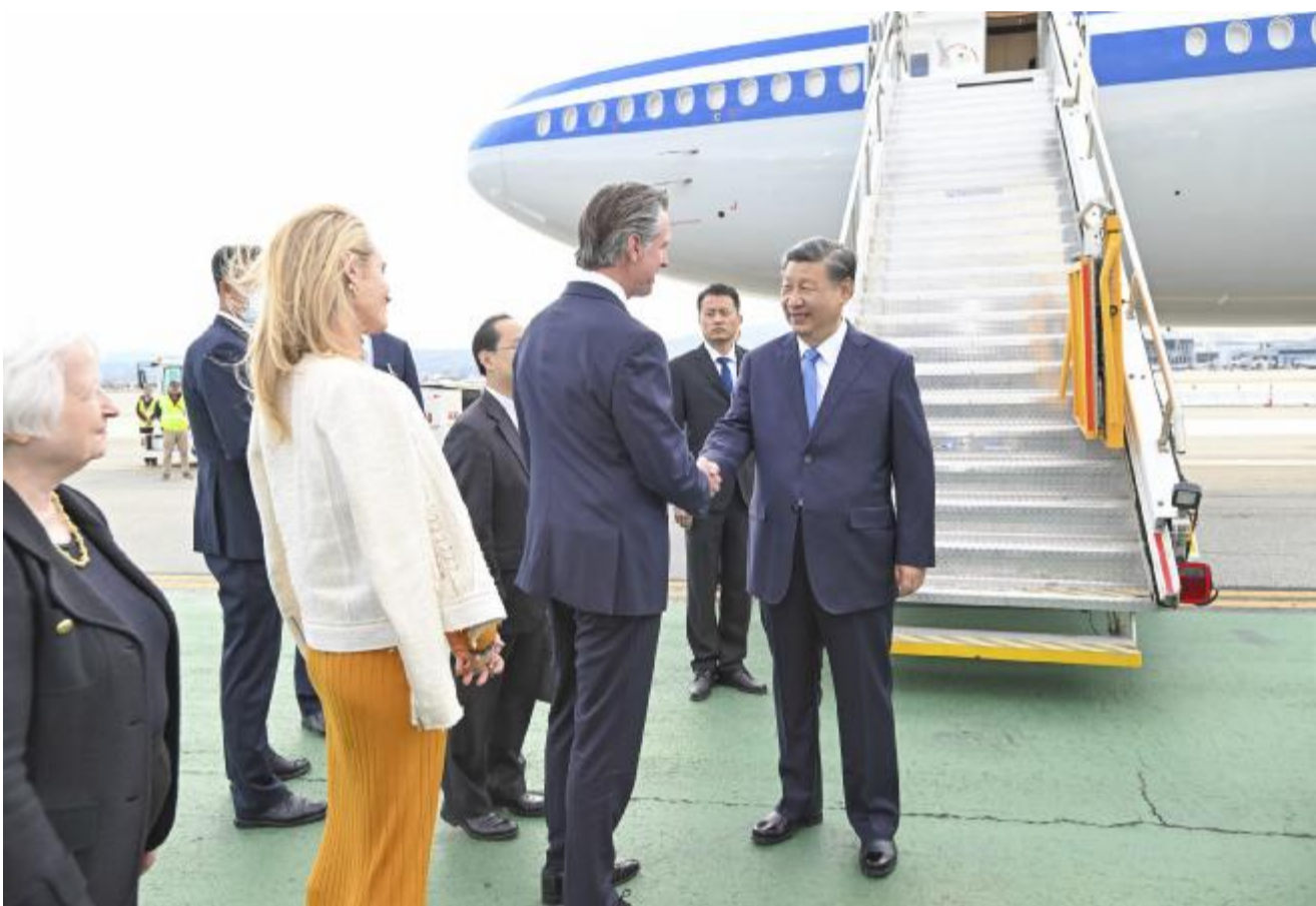
当地时间11月14日下午，国家主席习近平乘专机抵达美国旧金山，应邀同美国总统拜登举行中美元首会晤，同时应邀出席亚太经合组织第三十次领导人非正式会议。

习近平乘坐专机抵达旧金山国际机场时，受到美国加利福尼亚州州长纽森、财政部长耶伦等美方代表热情迎接。