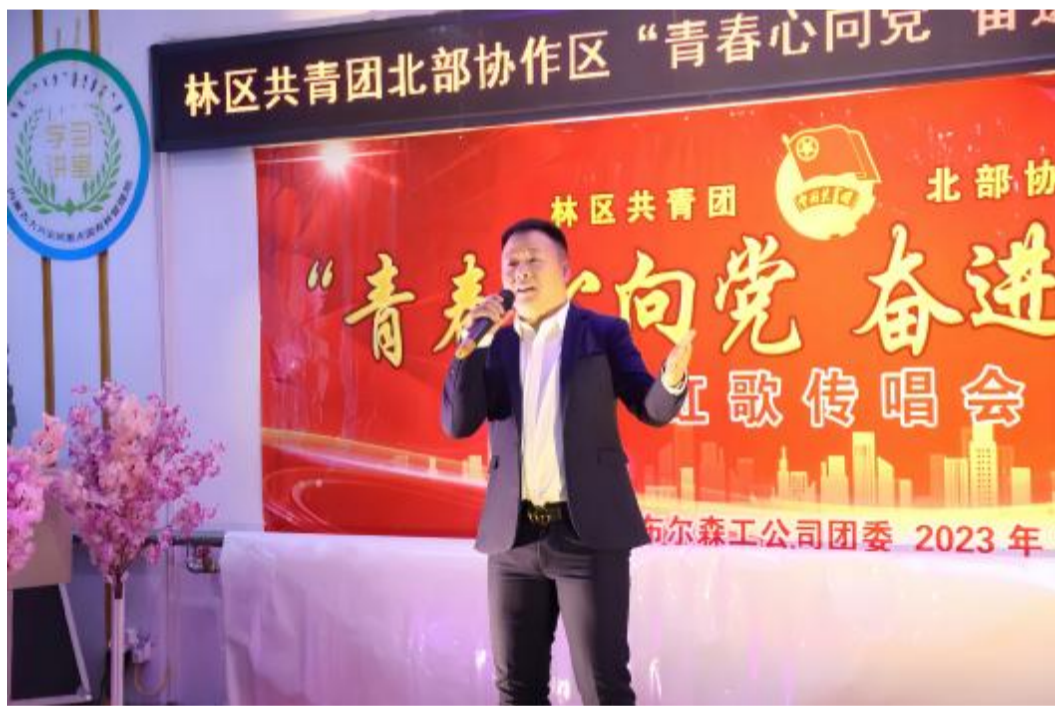
11月8日，由得耳布尔、莫尔道嘎、金河、阿龙山、满归森工公司和北部原始林区森林管护局等9家单位共青团组织，联合承办的内蒙古兴安岭林区共青团北部协作区“青春心向党 奋进新征程”红歌传唱会在得耳布尔森工公司举办，引导团员青年重温党的光辉历程，讴歌党的伟大事业，不断汇聚建功新时代的磅礴力量。