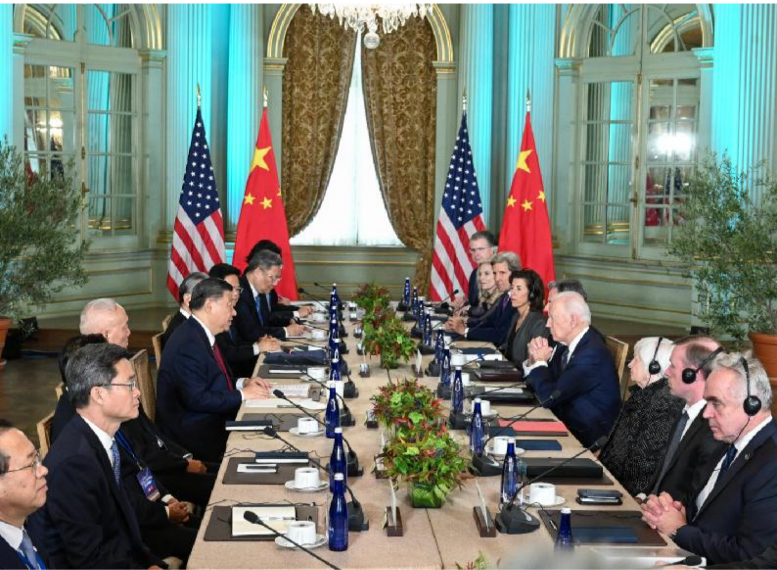
当地时间 11 月 15 日，国家主席习近平在美国旧金山斐洛里庄园同美国总统拜登举行中美元首会晤。