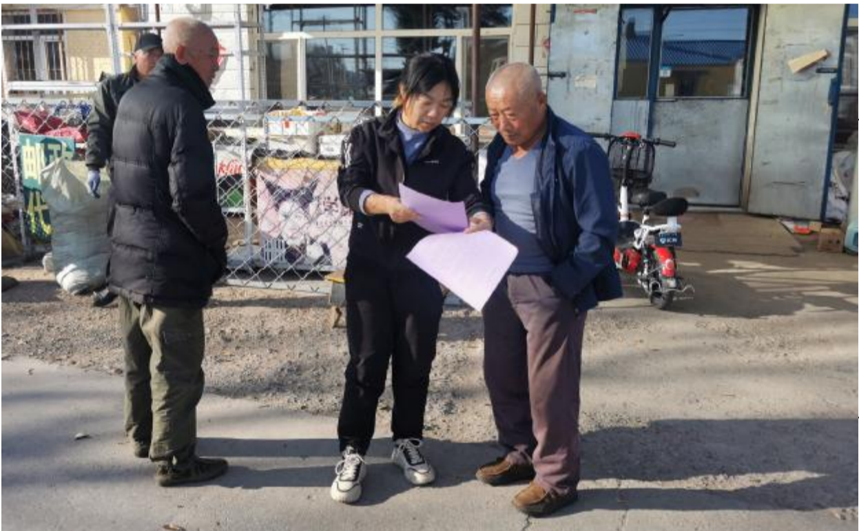
近日，巴林雅鲁河国家湿地公园通过“线上+线下”相结合的方式开展节能宣传活动，引导干部职工牢固树立节约粮食的观念，自觉养成节约的良好习惯。 图为向职工发放节约粮食宣传单。

在推进林草长制工作中，呼伦贝尔市紧紧围绕林草长制推进落实国土绿化、沙化土地治理、资源保护管理、生态产业发展、野生动植物保护、自然保护地体系建设、森林草原灾害防控及基层基础设施建设八个方面以“制”明“责”，以“制”促“治”，全面推进呼伦贝尔林草事业高质量发展。