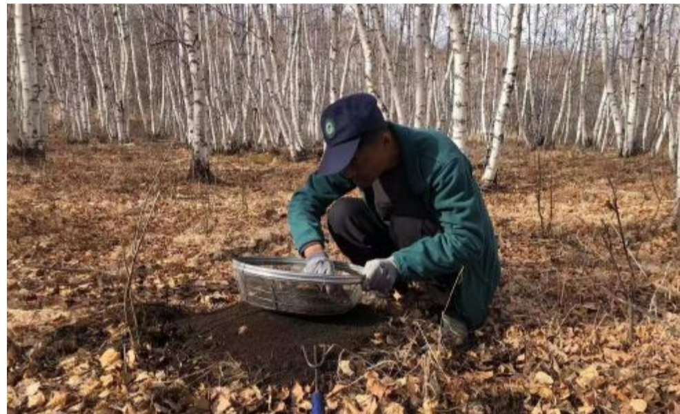
近日，红花尔基林业局林木病虫害防治检疫站组织专业技术人员对6个林场进行林业害虫越冬基数调查，通过刮取白桦树皮缝隙、查看松树干、翻查地面落叶腐植物等方式调查越冬蛹的数量，为2024年科学防控打下良好基础。 图为技术人员翻查地面落叶腐植物。

为巩固深化国有林场改革成果，库伦沟林场坚持以争创全国“十佳林场”为引领，加强资源保护，强化日常管理，发展绿色产业，完善基础设施，取得了一定成效。自2019年林场划归内蒙古图博勒国家森林公园管理局以来，该林场聚焦解决基础设施短板问题，加强防火应急中心、森林公园东西大门、森林公园游客接待中心及观景栈道等基础设施建设，打造宜游宜业的新环境。目前，林场基础设施、生态景观形象、生态旅游接待能力得到了提升。据统计，今年中秋、国庆双节期间，库伦沟林场景区接待游客超过7000余人次，客均消费较去年大幅提升，创下历史最好成绩。