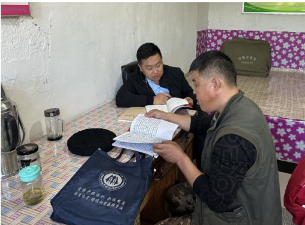
近日，红花尔基林业局宝根图林场党支部开展“送学到一线”活动。该林场党支部书记带着学习材料到各林场管护站，与一线职工共同学习《习近平新时代中国特色社会主义思想学习纲要》等相关内容，让驻守一线的职工学习上“不缺课”、理论上“不漏学”、精神上“不掉队”。

宝贵意见。 随后，评估组实地查看了该保护区生态环境保护、火烧迹地自然更新等情况，深入了解保护区的自然生态特征，并对该保护区在森林草原防火、疫病疫病监测、科研宣教等方面提出要求。