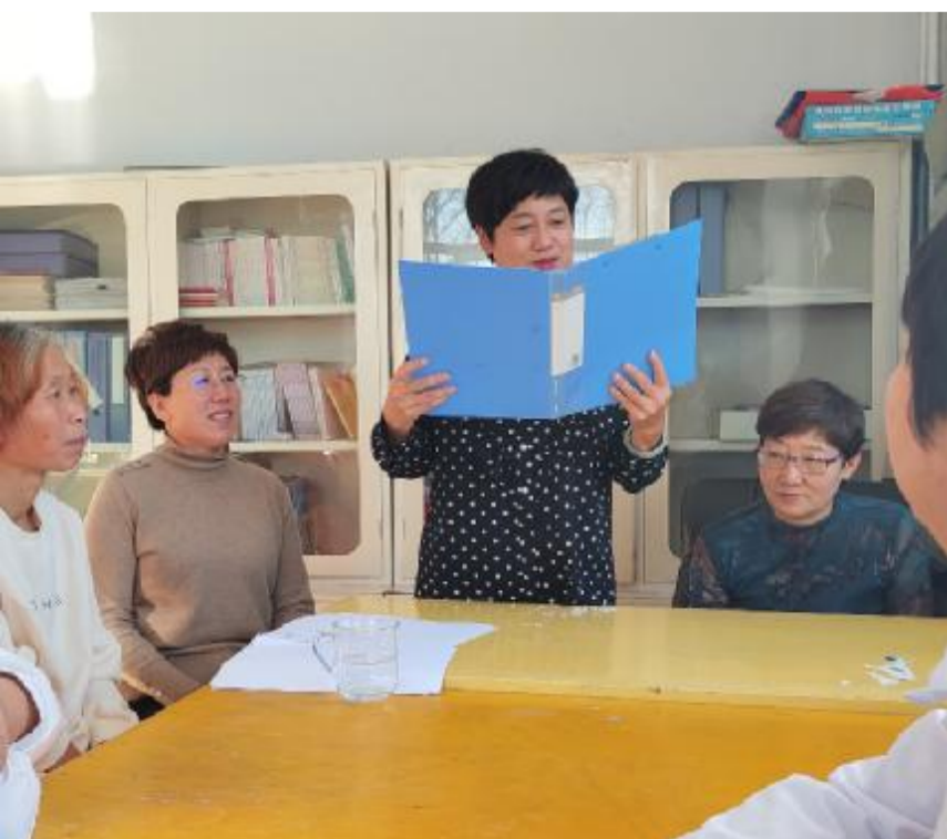
近日,阿龙山森工公司工会举办励志故事分享会,激励职工立足岗位,担当作为。 图为森工队职工分享励志故事。