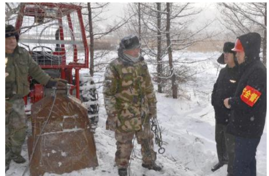
近日,伊图里河森工公司组成安全检查组,对17个基层单位进行安全检查,重点排查危险化学品、道路交通安全、森林可持续经营试点等方面工作,把安全隐患消灭在萌芽之时,确保安全生产形势稳定向好。 图为检查车辆。

安全生产知识,开展线上安全生产知识有奖答题竞赛;线下组织学习《安全生产法》《消防法》《环境保护法》等内容,发放日常生活用电、用气、用火、应急避险、逃生等安全知识宣传小册子;通过开展安全知识讲座、悬挂宣传横幅、发放宣传单,增强职工群众安全生产意识,营造人人关注安全、重视安全、参与安全的社会氛围。 该公司抓实安全生产教育培训,不定期集中开展各种安全专项培训,将培训成效转化为建强队伍、提高工作水平、服务高质量发展的实效。