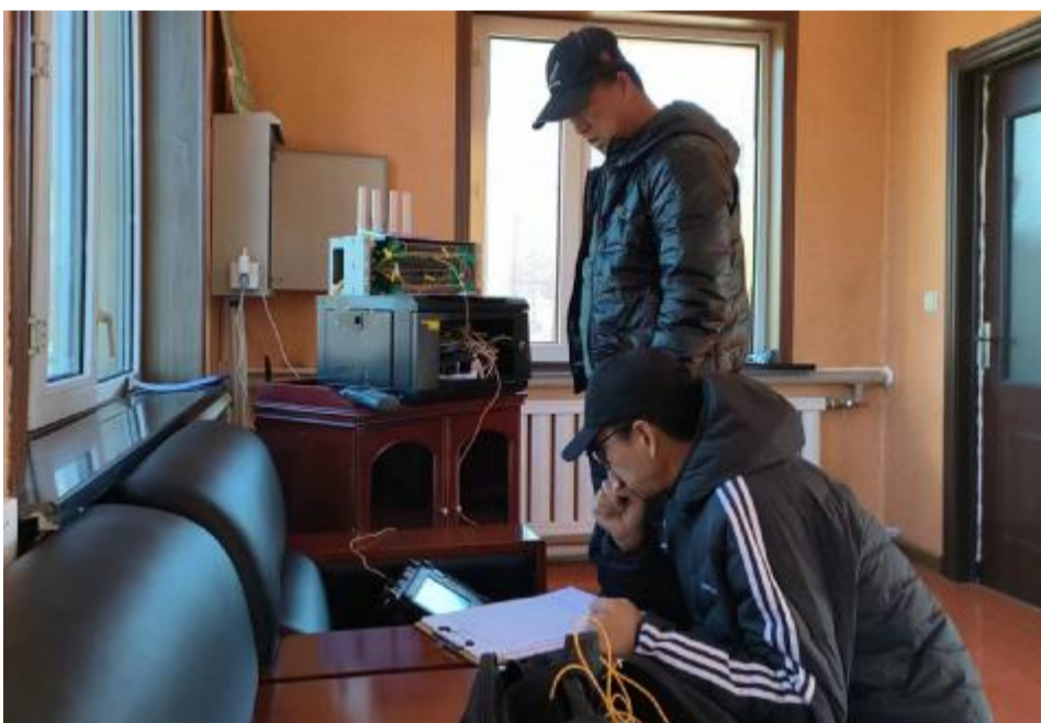
近日,满归森工公司信息中心检查维护各森林管护站的视频监控系统,确保监控设备正常运转。

教育无盲区,职工群众法治意识普遍增强;通过发放《家庭法治宣传教育读本》,开展宣讲活动、制作简篇小程序网页等方式,全方位进行宪法宣传;普法人员利用双休日,以入户拉家常、在家庭微信群宣传等方式,送法进家庭,引导职工群众知法、守法、用法。