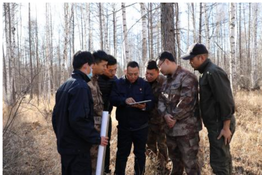
近日,伊图里河林业有限公司森调队组织新入职职工深入生产一线,开展林相图识别、GPS外业应用、平板电脑外业软件应用、外业调查等业务培训,使新入职职工熟练掌握岗位技能,达到学以致用、以学促干的目的。

该林场在办公室醒目位置张贴随手关灯、设备节电提示,落实具体责任人,做到人走关灯、关电源;办公用品采用双面打印,对无法再印的废纸作为草稿纸使用,减少纸张用量;做好新煤和旧煤的掺配,合理取用燃煤,提高燃煤利用率;加强公车管理,降低各种不必要的消耗和损耗。