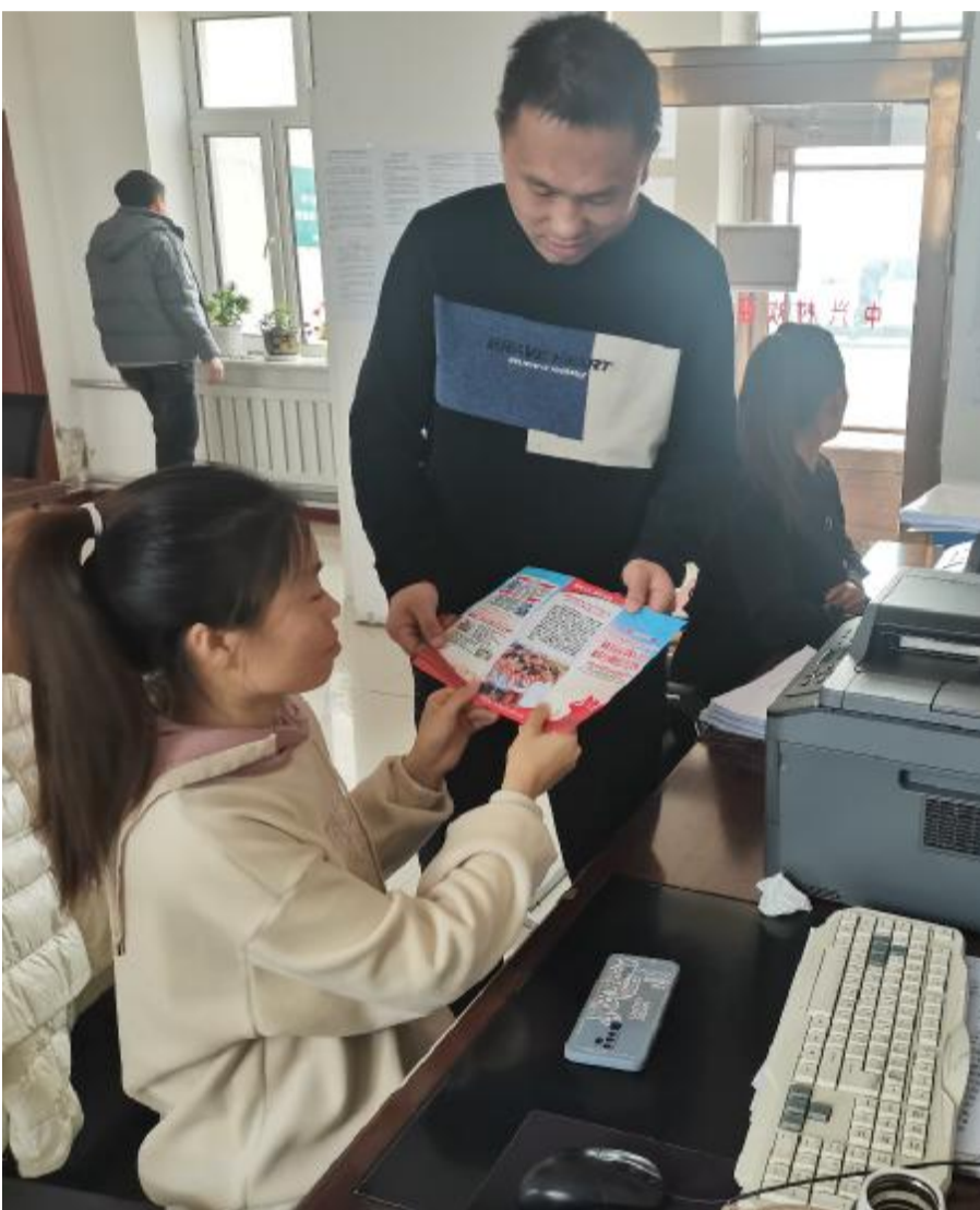
近日,毕拉河林业有限公司中心苗圃开展“禁毒宣传进社区 全方位筑牢禁毒防线”活动,旨在增强居民的识毒、拒毒、防毒意识,营造全民禁毒的浓厚氛围。图为宣传人员向社区工作人员发放禁毒宣传传单。