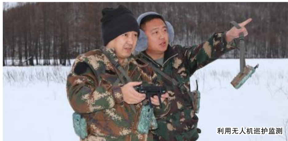
利用无人机巡护监测