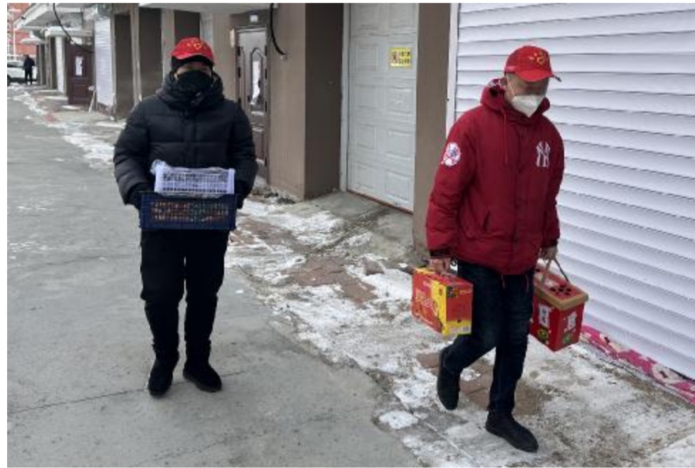
近日,阿里河森工公司应急事务处团支部开展入户助困帮扶志愿服务活动,志愿者走进困难职工家中,为其送上慰问品,并清理院落卫生。