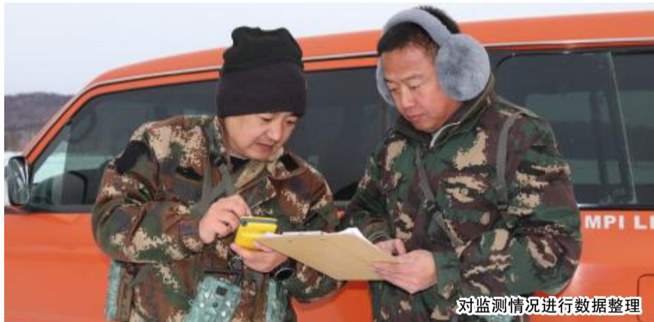
对监测情况进行数据整理