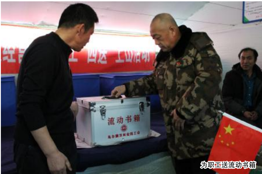
为职工送流动书箱