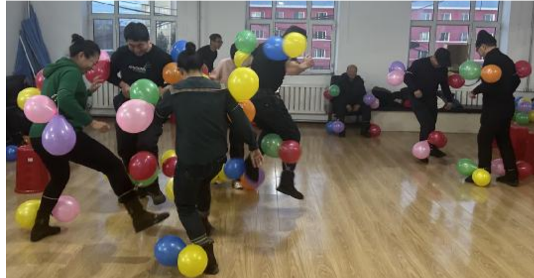
近日,阿里河森工公司产业事业处举办“玩转趣味游戏 享受快乐生活”趣味游戏活动,展现职工健康向上、充满活力的精神面貌。 ■郎婧婕 报

该林场组织技术人员对单位用水设施进行日常维护检修,及时更换老化的供水管道及零部件,并在明显处张贴“节约用水”提醒标识,杜绝跑冒滴漏现象发生;加强对办公用品使用和管理,规范设施材料采购、领取手续;严格纸张管理,控制纸质文件、简报的打印数量,提倡对允许网络传达的材料在网络传输,需要打印的材料实行双面打印,减少不必要的纸张浪费;在用电管理上,各股室改用节能灯,做到随手关灯、人走灯灭,杜绝“常明灯”现象的发生。