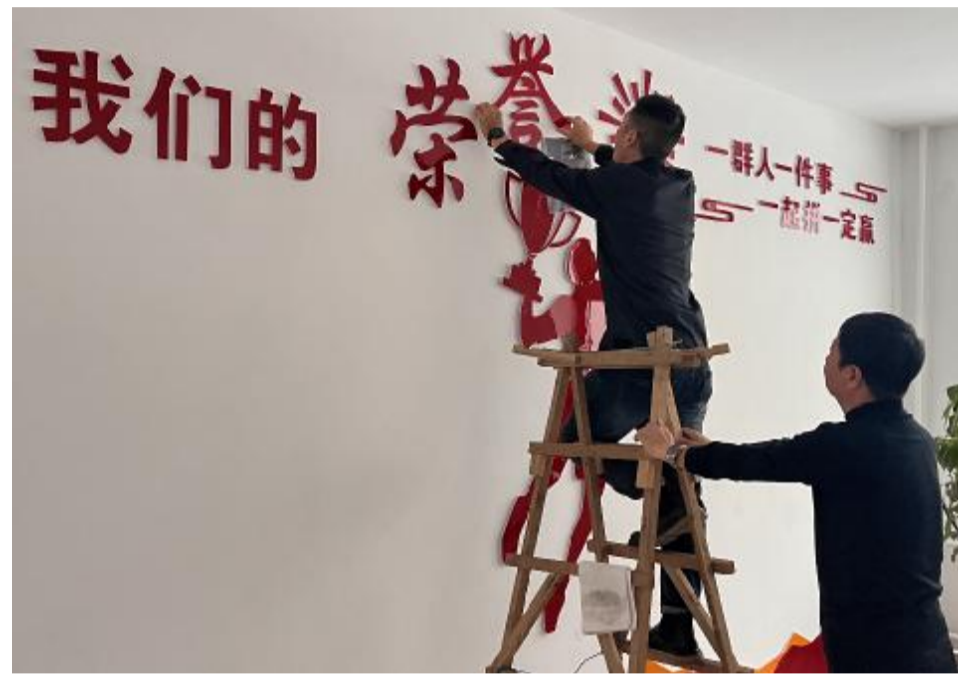
近日,克一河森工公司应急事务处利用走廊、会议室等墙面,精心打造文化墙。

该党支部开展主题党日活动,组织党员参观红色教育体验馆,强化党员党性意识,增强党员的使命感和责任感;加强党员日常监督,严格落实民主评议制度,采取党员自评、党员互评、民主测评、组织评定等方式,评定党员综合表现;利用党员积分管理办法,对党员参加组织生活、发挥作用等情况进行积分统计,督促党员增强自律意识。