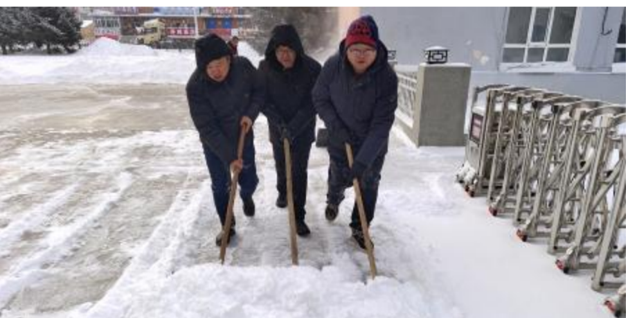
近日,库都尔森工公司哈牙世德林场团支部开展“我是志愿者,我帮你”清雪保畅通活动,保障职工群众出行安全。

风,强化岗位责任意识;建立完善责任体系,各岗位自觉把责任意识转化到日常工作中,做好本职工作;定期开展廉洁专题学习,要求党员干部撰写廉洁教育学习心得,引导党员干部自觉抵制诱惑,做到自省、自警、自励,营造爱岗敬业、廉洁自律的工作氛围。