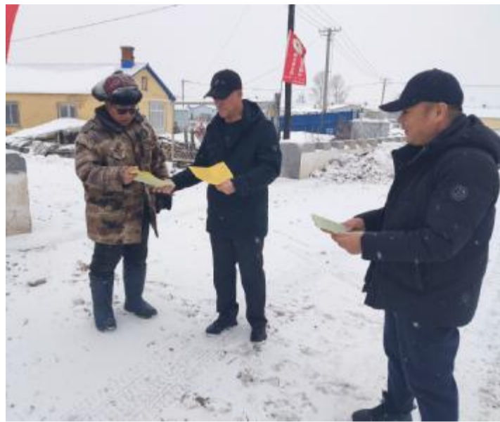
近日,大杨树林业有限公司四平山林场开展《内蒙古自治区全方面建设模范自治区促进条例》等六部促进条例学习宣传活动,让职工群众了解条例的深刻内涵和重要意义,增强铸牢中华民族共同体意识的政治自觉、思想自觉、行动自觉。