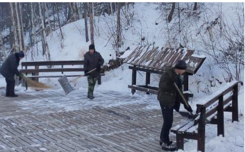
连日来,金河森工公司金林林场组织职工清扫栈道积雪,为在冷极村旅游的游客提供良好的体验。

资源分布情况,成立了机动巡护组,不定期对生态功能区内野生动物分布较多的地点重点巡查检查,记录每次巡查检查情况,严守森林资源生态红线;加强对营林生产区域的排查,严防出现破坏森林资源的行为,规范森林资源管理秩序。