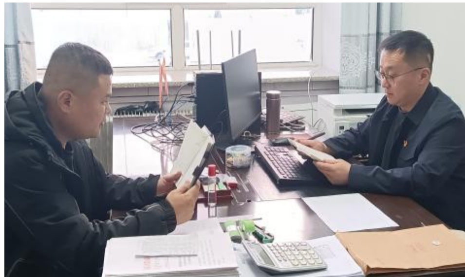
近日,库都尔森工公司森林经营管理处开展“一对一”廉政谈话,对发现的苗头性和倾向性问题及时提醒,提高了重点岗位、关键岗位人员拒腐防变能力。