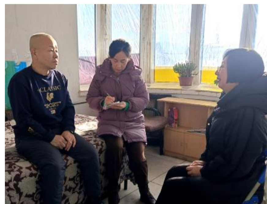
日前,金河森工公司萨河林场通过入户走访、电话、微信访谈等方式核查困难职工情况,详细了解困难职工的致困原因、帮扶需求,确保帮扶工作有效落实。