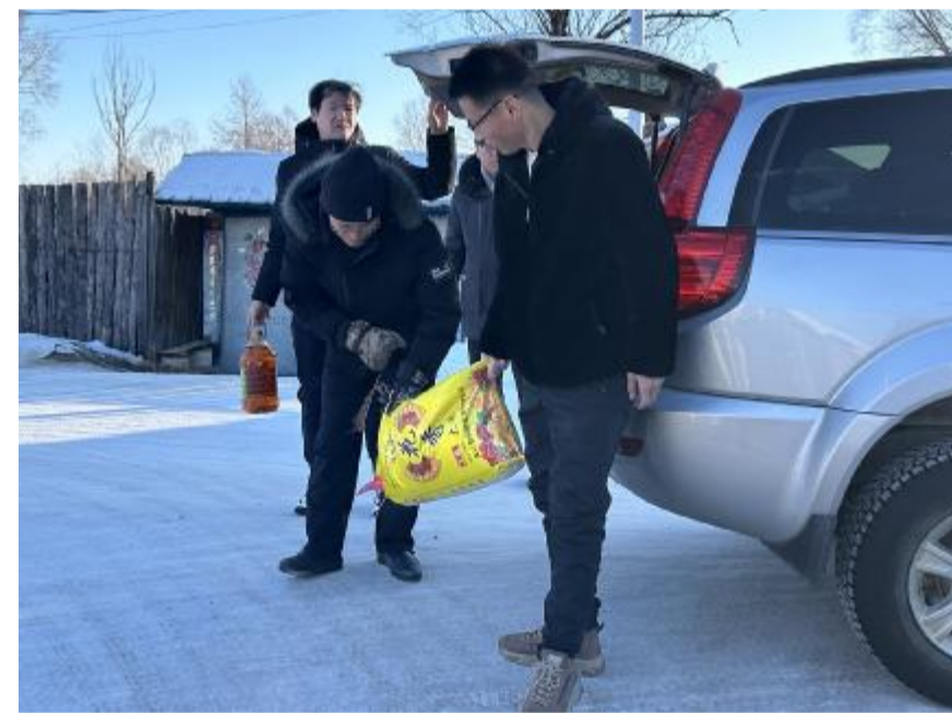
1月26日,克一河森工公司霍都奇林场团支部开展“青春暖流 冬日送温暖”活动,为困难群众送去了大米、豆油等生活物资,并鼓励他们树立对生活的信心,帮助他们度过一个温馨祥和的春节。图为工作人员为困难群众送去生活物资。