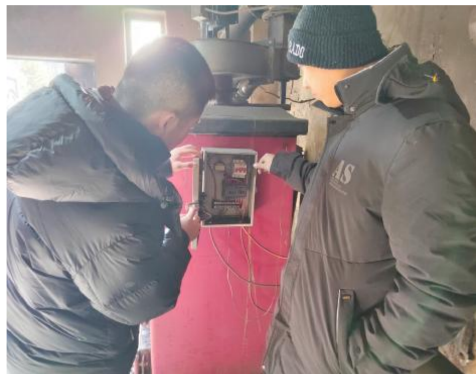
连日来,大杨树林业有限公司奎中林场开展消防安全检查工作,对办公场所及厨房、宿舍、锅炉房等重点场所的用电线路、配电箱、空气开关等规范使用情况实地排查,发现隐患及时整改,确保不发生各类安全事故。