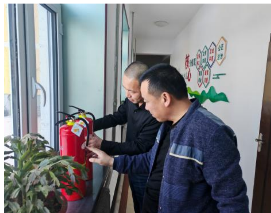
近日,克一河森工公司自然保护地管理处组成安全领导小组,对消防器材进行隐患排查,保证灭火器材的安全性和有效性。