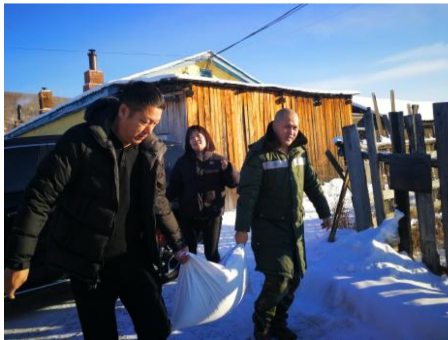
近日,阿龙山森工公司物资供应处工会组织人员深入困难职工家中走访慰问,为他们送去米、面、油等慰问品,详细了解困难职工的身体情况、生活情况和实际困难,听取他们对单位的意见建议。

量食堂专用电蒸锅;为快速扑火队员配备由毛巾、牙刷、雨衣等用品组成的轻便行军包,并配备轻便头灯,满足队员夜行需要;在林场院内新建50平方米调度门卫值班室,并对办公楼供暖系统进行改造,改善职工工作环境。