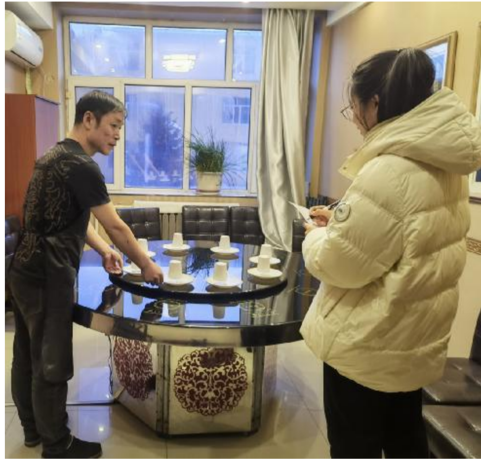
近日,满归森工公司产业事业处旅游办公室对满归地区部分宾馆、饭店进行走访调研,进一步掌握本地区的旅游接待能力和服务质量,为做好公司旅游服务工作打下良好基础。

该党支部严格履行日常信息监督管理责任,加强微信公众号、工作群、新闻宣传的制度建设和保障宣传媒体运行有序、信息内容规范;修订完善了《意识形态阵地建设方案》《微信公众号、工作群信息发布管理办法》,守好意识形态主阵地。