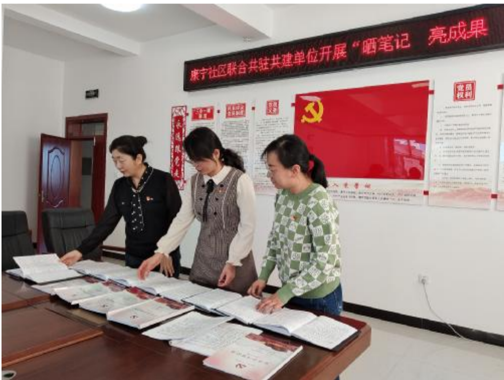
近日,阿里河森工公司森调队党支部联合康宁社区开展“晒笔记、亮成果、促学习”主题党日活动,通过党员学习笔记展评,促进党员找差距、互学习、同提高,持续推进学习型党支部建设。